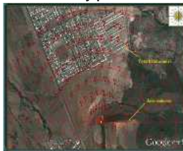
Figura 1. Mapa del área de estudio