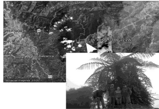
Figura 1. Lugar de colección de las pinas fértiles de Cyathea aff. caracasana .

Wang B and Qiu Y. L (2006). Phylogenetic distribution and evolution of mycorrhizas in land plants. Mycorrhiza 16 :299-363.