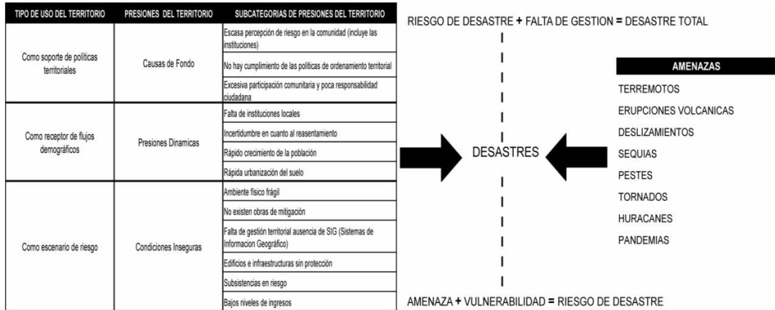
Gráfico 1. Presiones del territorio y escenarios de riesgo.