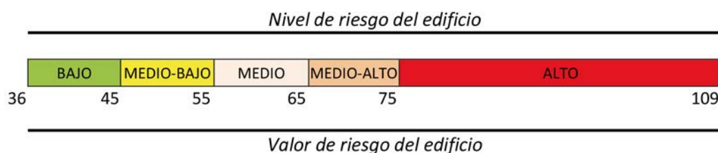
Figura 2. Representación gráfica equivalencia valores de riesgo-niveles de riesgo.

La representación gráfica de la equivalencia de valores-niveles de riesgo se indica en la figura 2.