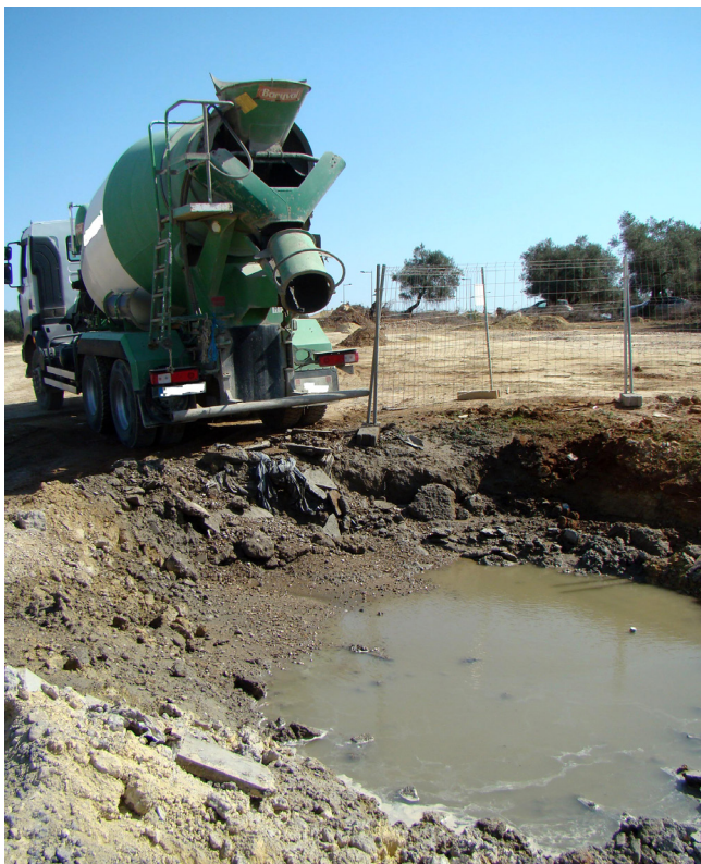
Figura 2. Vertido de aguas de lavado procedentes de camión hormigonera sin recuperación.

clada y también se neutraliza el impacto ambiental resultante de su vertido. Salvo casos excepcionales el único tratamiento previo que demandaría esta agua para alcanzar una densidad inferior a 1,3 \text{ g/cm}^3 es la eliminación de partículas finas procedentes del árido ( >0,063 \text{ mm} ) y de los fenómenos de floculación y fraguado parcial que haya podido desarrollar el cemento, en estos casos bastaría con un tratamiento de sedimentación o filtrado mecánico, estableciéndose como límite total de sólidos 185 \text{ kg/m}^3 (28). Al igual que ocurre con otros materiales reciclados, las características fisicoquímicas del fluido resultante serán las que determinen el tipo de tratamiento y la posibilidad de uso (29).