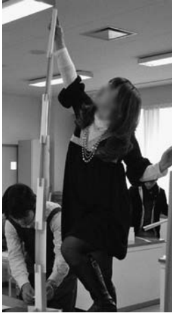
図 11 高い塔

平成 29 年度には、従来の内容とは変えて、厚紙や装飾用オーナメント、ビーズ、折り紙などを組み合わせて、バランスを取りながら立体を構成しました (図 12、図 13)。