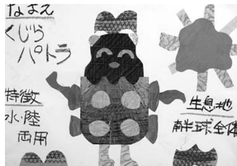
図2 未知の生物 2