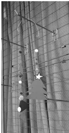
図 12 モビール

平成 29 年度には、従来の内容とは変えて、厚紙や装飾用オーナメント、ビーズ、折り紙などを組み合わせて、バランスを取りながら立体を構成しました (図 12、図 13)。