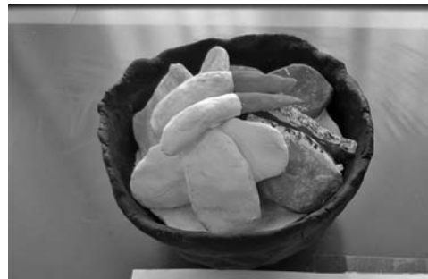
図10 昨夜の食事（海鮮丼）