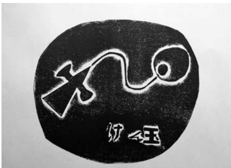
図6 日曜にしたこと2(わくわくけん玉)