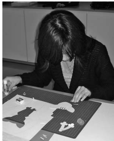
図4 日曜にしたこと（凸版作り）