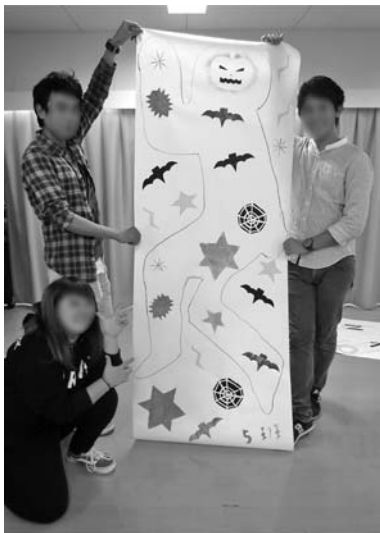
図3 孔版を使ったグループ作品