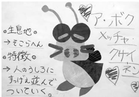
図1 未知の生物 1

できた生き物に「名前」をつけ、生息地や特徴も書き込み、その作品をお互いに見せ合う（図1、図2）。