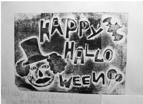
図5 日曜にしたこと1