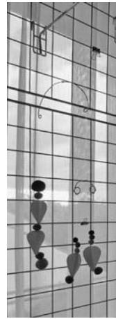
図 13 モビール