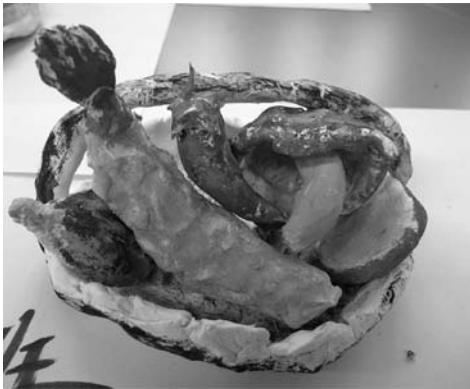
図9 昨夜の食事（天ぷら） （ニスを塗って光沢を出しています）

学生の感想：実際に食べたものでも、作ろうと思うと形にするのが難しく、よく見ていないことに気が付いた。