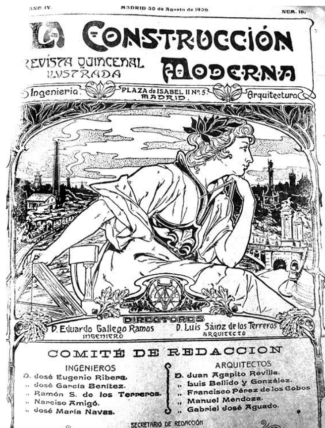
Figura 2. Portada de la revista La Construcción Moderna de 30 de mayo de 1906.