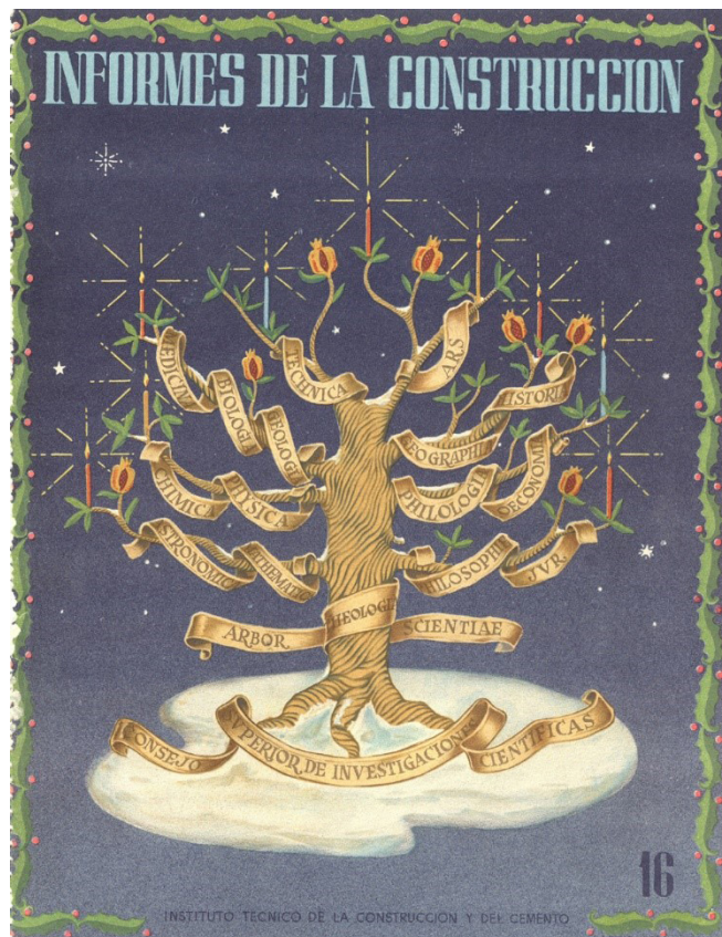
Figura 4. Portada del número 16 de la revista Informes de la Construcción .

Asimismo, sigue publicándose Cemento y Hormigón , que es asumida por el Instituto del Cemento . Este se fusiona en 1949 con el Instituto Técnico de la Construcción y Edificación, por lo que la revista pasa a editarse desde el nuevo Instituto Técnico de la Construcción y del Cemento , dirigido también por Eduardo Torroja. Más adelante, ambas instituciones vuelven a separarse y la revista queda en manos de Oficemen hasta la actualidad (8).