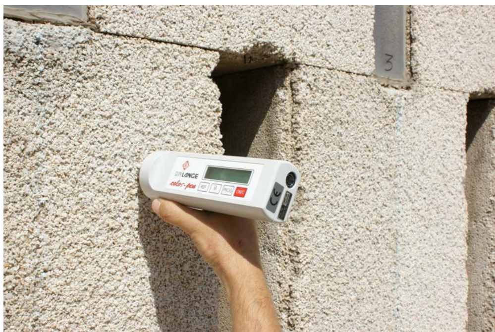
Figura 5. Determinación colorimétrica sobre placa de fachada.

Con los productos seleccionados a partir de la información suministrada por los análisis de los FTIR sobre la similitud de resinas actuales y la original se realizaron pruebas de capacidad consolidante. La elevada porosidad de las piezas y su sección (1,5 cm) permitía, a priori , presuponer una correcta penetración de los productos a través de la estructura de poros/huecos, en cualquier caso, como evaluación previa, se aplicaron las resinas sobre las probetas por pulverización hasta saturación superficial, pudiéndose comprobar la penetración alcanzada por el afloramiento de producto en la cara posterior de las probetas. Igualmente, con el fin de comprobar los tres productos se aplicaron en el laboratorio mediante pulverización en spray sobre marmolina limpia y suelta,