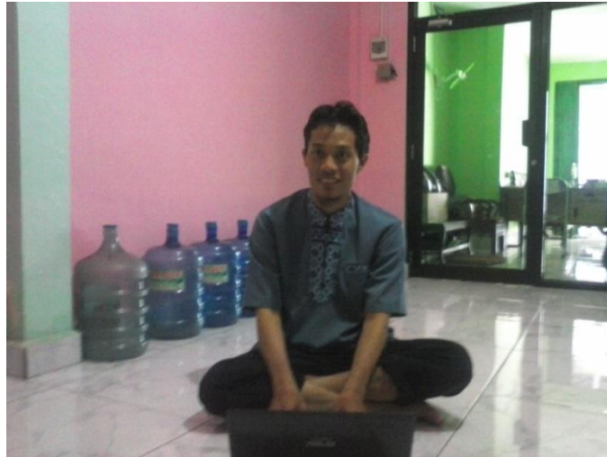
Gambar 1. Pelatihan Pemanfaatan Aplikasi Pengolahan Data berbasis Web pada Usaha Air Bersih

Pemahaman pemanfaatan aplikasi pengolah data berbasis web bagi usaha air bersih, dapat meningkatkan produktivitas kinerja dengan memanfaatkan teknologi Informasi. Kemampuan penggunaan aplikasi pengolah data berbasis web bagi usaha air bersih dan pemeliharaannya untuk berbagai keperluan dapat dipergunakan oleh para pekerja untuk keperluan diluar dari kepentingan usaha. Dengan pengetahuan dasar penggunaan komputer yang baik, diharapkan para pekerja Usaha Air Bersih di Kelurahan Muara Dua Kota Prabumulih khususnya, dapat mengembangkan ilmu yang didapat selama pelatihan. Dapat membantu Usaha Air Bersih di Kelurahan Muara Dua Kota Prabumulih semakin maju dan berkembang dikarenakan meningkatnya keahlian dan keterampilan yang dimiliki oleh para pekerja.