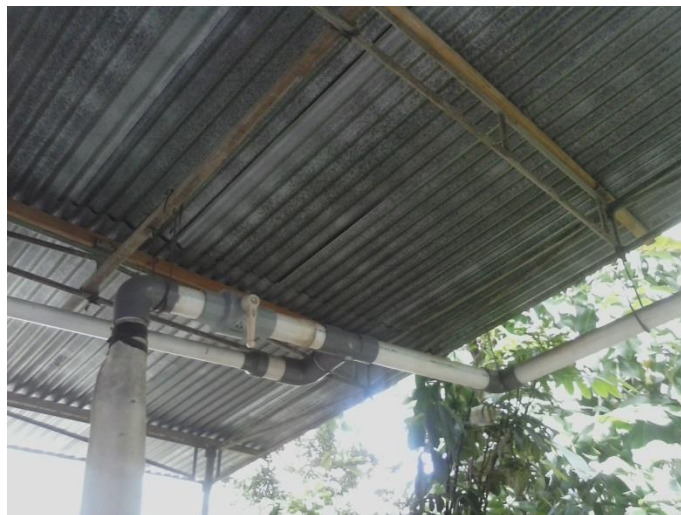
Gambar 2. Instalasi Penyaluran Air Bersih