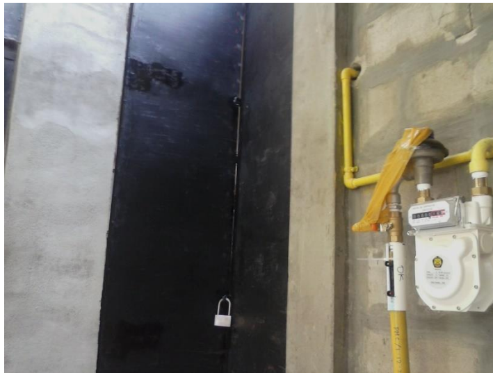
Gambar 3. Instalasi Penyaluran Air Bersih