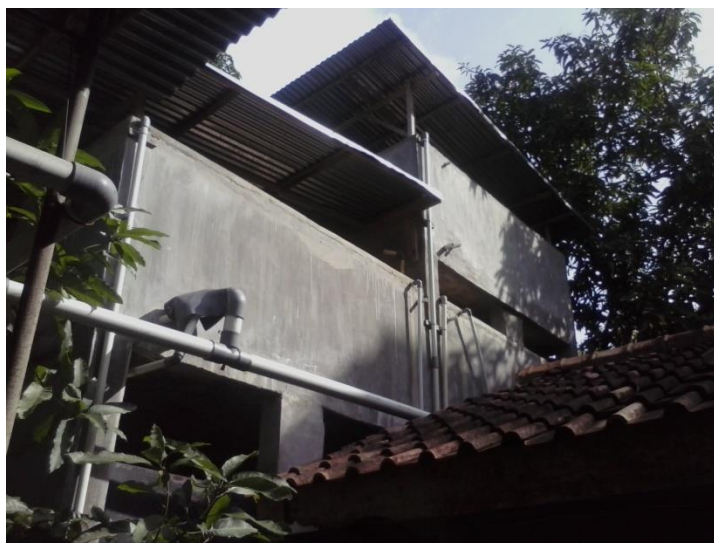
Gambar 5. Tempat Penampungan Air Bersih