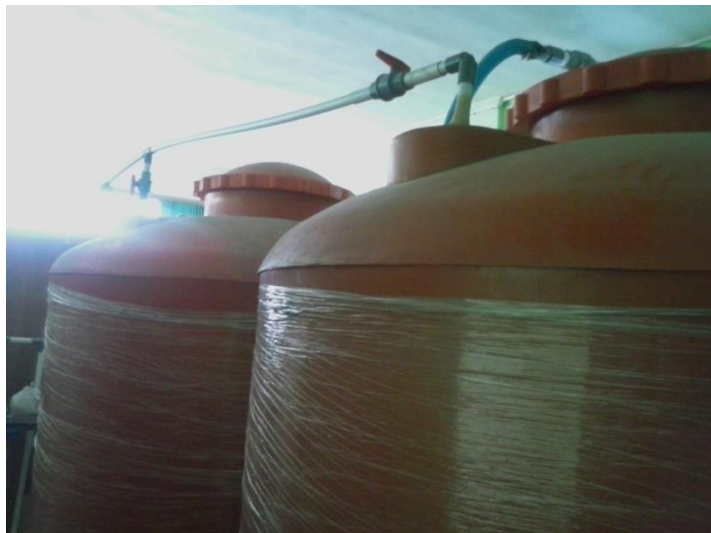
Gambar 4. Tempat Penampungan Air Bersih