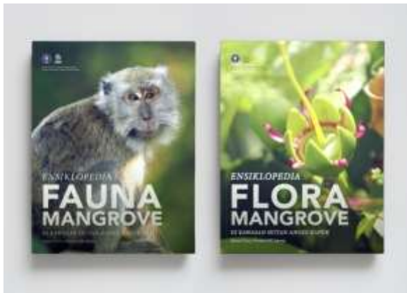
Gambar 2. Ensiklopedia Fauna dan flora

Media promosi dari dinas pariwisata yang kurang menarik dari segi desain, terutama pada foto objek wisata, maka pada Perancangan Ensiklopedia Pariwisata Alam Kota Pagar Alam memilih ensiklopedia sebagai media utama. Ensiklopedia memiliki informasi yang lengkap, layout yang menarik, berbeda dari media promosi pariwisata lainnya.