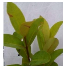
Gambar 1. Daun pucuk idat

fitokimia ekstrak etil asetat Cratoxylum glaucum pada penelitian ini menggunakan beberapa metode uji meliputi uji alkaloid, fenol hidrokuinon, flavonoid, saponin dan steroid.