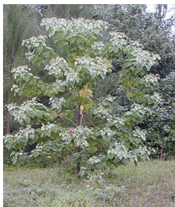
Gambar 1. Tumbuhan M. umbellata (Houtt) stapf var. Visenia

Kleinhovia , Melochia umbellata (Houtt) Stapf var. Degrabrata dan Melochia umbellata (Houtt) Stapf var. Visenia dari spesies M. umbellata (Houtt) Stapf dan genus Melochia .