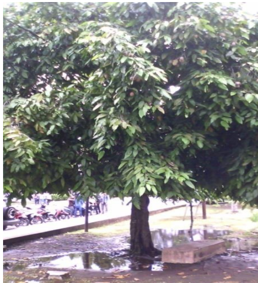
Gambar 1. Contoh Pertumbuhan dan Produksi Tanaman Atung pada Lokasi Kampus Unpatti

Berdasarkan orientasi lapangan yang penulis lakukan tentang kondisi lahan tempat tumbuh tanaman Atung di lokasi kampus Unpatti poka, dapat disimpulkan bahwa tanaman Atung cenderung tumbuh optimal pada wilayah pesisir dengan jenis tanah Regosol halus berwarna hitam hingga agak kekuningan ke dalam tanah (pengaruh warna pasir halus), dengan kondisi iklim yang di bagi menjadi 3 bagian yaitu: curah hujan 3725 mm, temperatur 24,2°C, kelembaban 78%. Kondisi Fisiografi untuk ketinggian 8 mdpl, lereng 2%(datar), untuk kondisi tanahnya kedalaman >100 cm, tekstur pasir berlempung, lempung berdebu, pasir, struktur lepas atau gembur, serta drainase tanahnya baik. Pada studi awal ini, jumlah buah Atung (Gambar 1) per pohon berkisar 83 buah, bahkan ada tiga buah yang telah jatuh atau gugur secara alamiah.