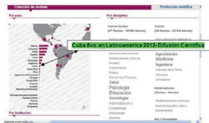
Figura 1.

El posicionamiento en difusión, es un indicador importante para la producción científica, uno de sus exponentes más emblemático y propiciador de altos índices de producción científica. En la comunidad científica Latinoamericana la Red de Revistas Científicas de América Latina y el Caribe, España y Portugal, (Redalyc) ubica a Cuba en el 8vo. lugar, según datos de 2012, evidenciados a partir del total de publicaciones cubanas que existen en este repositorio, 22 revistas en total. Los criterios que establece esta plataforma difusora están implementados en las publicaciones cubanas en correspondencia a los modelos de comunicación científica establecidos por la comunidad internacional. (ver figura 1.)