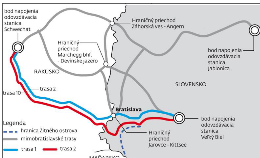
Obrázok 2: Dve trasy BSP preferované MH SR

V januári 2013 MH SR preložilo vláde informáciu o stave projektu, v ktorom preferuje dve trasy (Vláda SR 2013). Obe sú súčasťou tzv. mestského koridoru a prechádzajú intravilánom a extravilánom mesta Bratislava. Tieto dve trasy následne vláda schválila ako jediné možné alternatívy trasovania BSP. Obe vychádzajú z napájacieho bodu vo Veľkom Bieli, pričom priamo prechádzajú cez mestské časti Bratislavy – Podunajské Biskupice a Ružinov, prechádzajú popri Prístavnom moste cez Dunaj kde sa rozdeľujú na jednotlivé vetvy. Trasa 1 vedie priamo cez mestskú časť Bratislava – Petržalka, cez Einsteinovu ulicu, v tesnej blízkosti obchádza zdroj podzemnej pitnej vody Pečniansky les, ďalej pokračuje popri diaľnici D2 a končí pri hraničnom priechode Berg. Trasa 2 vedie z Prístavného mosta cez Dolnozemsú cestu, v tesnej blízkosti obchádza vodársky zdroj Rusovce – Ostrovné lúčky – Mokrad' a končí na hraničnom priechode Kittsee (viď Obrázok č. 2).