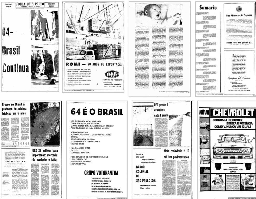
Figura 1. Algumas páginas do Caderno Especial “64 – Brasil Continua”.

A edição do Caderno Especial do Jornal Folha de São Paulo possui 44 páginas e foi publicado no dia 31 de março de 1964. Inicia-se com a figura de pessoas caminhando e com o enunciado “64 – Brasil continua” preenchendo toda capa, a fim de promover o potencial de desenvolvimento do Brasil. Em termos de estrutura, esse suplemento é um imbricamento de reportagens, editoriais e propaganda de empresas. Por exemplo, já na segunda página, ainda antes do editorial do jornal presente na página três, contém uma mensagem das Indústrias Romi S.A comemorando seus 20 anos de exportação.