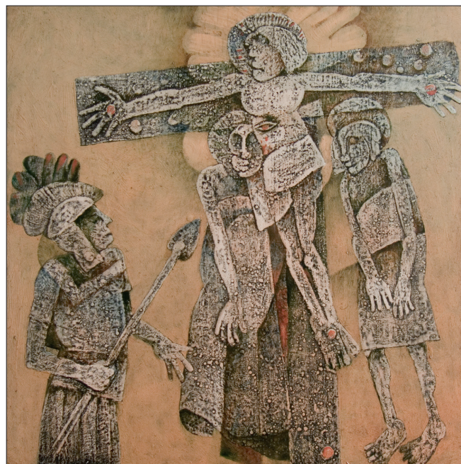
Obr. 8. Z cyklu Křížová cesta , 2007, kombinovaná technika na dřevě, 60x60 cm. From the series Stations of the Cross , 2007, combined techniques on wood, 60x60 cm. Aus dem Zyklus Kreuzweg , 2007, kombinierte Technik auf Holz, 60x60 cm.

His subsequent fascination with water fauna, the abundant kingdom of insects and other entities inspired themes of non-existent water creatures and prehistoric animals of mythical proportions. The artist exaggerates them into the dimensions of the painting surfaces with attention and care that testifies to his profound relationship with nature and its creatures as well as to the power of imagination that leads to the task of the