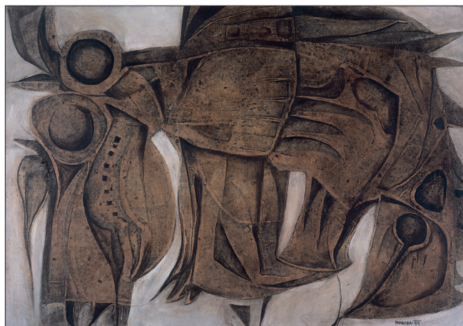
Obr. 3. Vosa, která píchla Viktorii , 1969, kombinovaná technika na plátně, 66,5x95 cm (Muzeum města Brna). The Wasp that Stung Victoria , 1969, combined techniques on canvas, 66,5x95 cm (City of Brno Museum). Wespe, die Viktoria stach , 1969, kombinierte Technik auf Ölwand, 66,5x95 cm (Museum der Stadt Brünn).

Od konce let osmdesátých a zvláště po roce 1990 vznikají ve Svobodově ateliéru malby – ve srovnání se staršími pra-