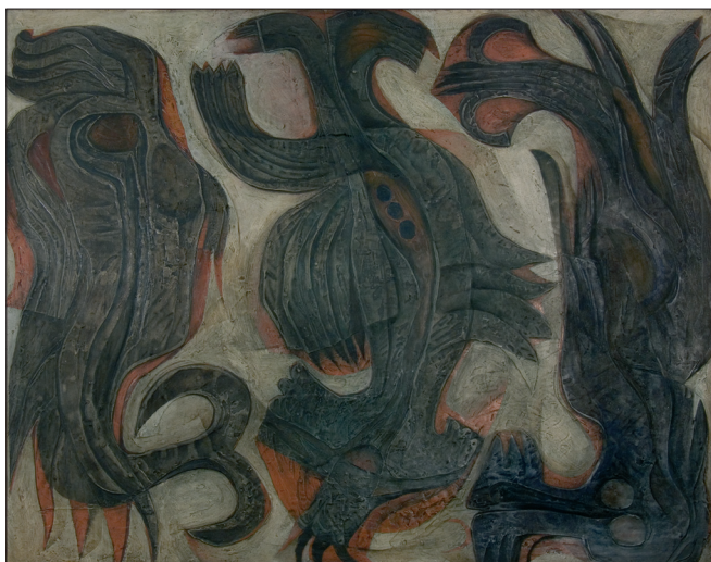
Obr. 5. Tři Grácie, 1970, kombinovaná technika na dřevě, 117x147 cm. Three Graces, 1970, combined techniques on wood, 117x147 cm. Drei Grazien, 1970, kombinierte Technik auf Holz, 117x147 cm.

– podoby hmyzích, vodních a dalších tvorů, především ptáků, ale také nových pololidských, polozvířecích bytostí zbavených někdejší statičnosti.