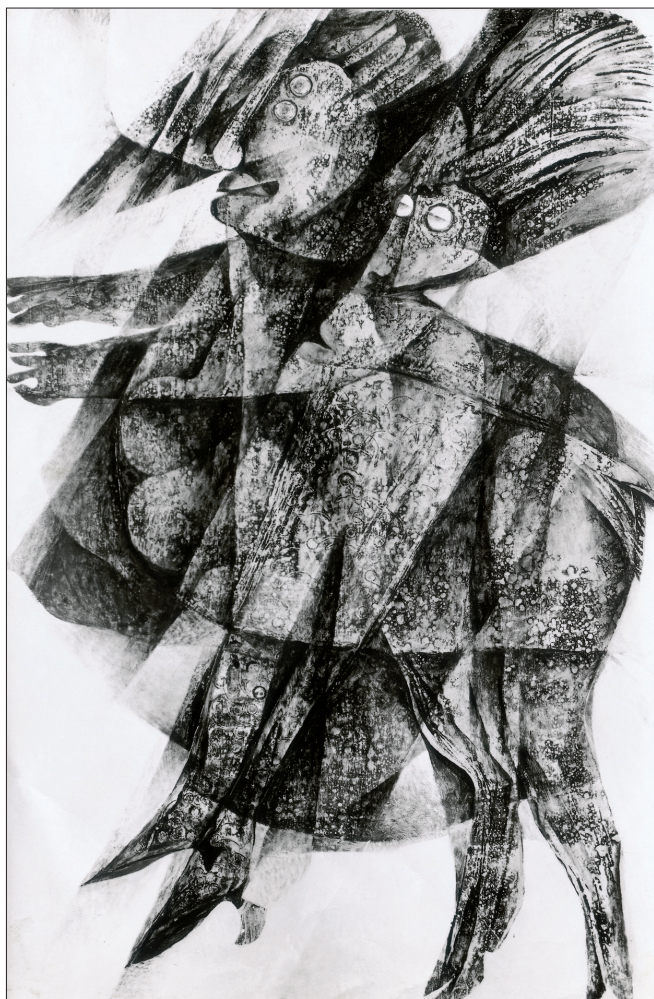
Obr. 7. Sabbat , 1986, kombinovaná technika na dřevě, 122x81 cm. Sabbath , 1986, combined techniques on wood, 122x81 cm. Sabbat , 1986, kombinierte Technik auf Holz, 122x81 cm.

circle. The impulse which Svoboda gained when encountering the works of the representatives of the Prague Art Informel perfectly corresponded to his own creative disposition and direction. This was also coupled with his passion for nature, which had influenced his original choice to study at the Veterinary Faculty. Although he terminated his studies quite early on, the traces of what was practically a scholarly interest in exploring living organisms can be found in many of his abstract works; there are compositions with unusual motifs such as the inner ear and cardiac musculature. The basis of his deepest interest is the organism; its dissection can lead to the discovery of its vital functions, which can then in turn be transposed into a form of unique creative expression.