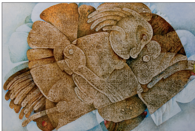
Obr. 14. Panenka , 2006, kombinovaná technika na dřevě, 80x120 cm. Doll , 2006, combined techniques on wood, 80x120 cm. Puppe , 2006, kombinierte Technik auf Holz, 80x120 cm.

Die nachfolgende Bewunderung für die Wasserfauna, das vielfältige Käferreich und weitere Lebewesen brachte Motive mit nicht existierenden Wassertieren und urzeitlichen Kreaturen von sagenhafter Gestaltung mit. Der Künstler wirft sie in überdimensionaler Vergrößerung auf die großformatige Leinwand. Aufgewandte Aufmerksamkeit und Sorgfältigkeit bezeugt sowohl seine unmittelbare Beziehung zur Natur und ihren Geschöpfen als auch die Kraft seiner Fantasie, die ihn