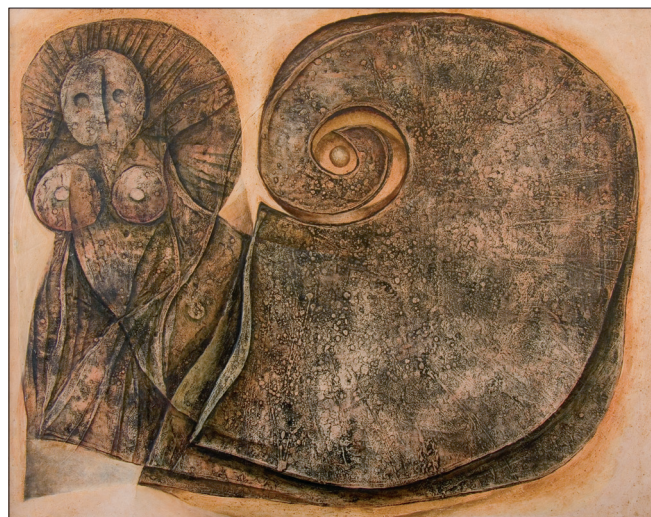
Obr. 6. Zrození Venuše, 1977, kombinovaná technika na dřevě, 120x158 cm. The Birth of Venus, 1977, combined techniques on wood, 120x158 cm. Geburt der Venus, 1977, kombinierte Technik auf Holz, 120x158 cm.