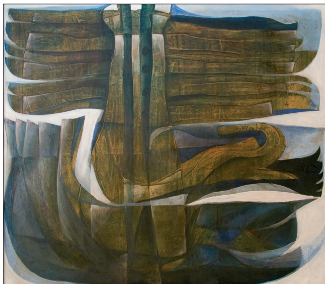
Obr. 2. Vikingové , 1968, kombinovaná technika na dřevě, 90x100 cm. The Vikings , 1968, combined techniques on wood, 90x100 cm. Wikinger , 1968, kombinierte Technik auf Holz, 90x100 cm.

hrozivě útočných mohutných tvorů představujících skrytá i zjevná nebezpečí. V letech osmdesátých následují kromě jiných i figurální díla zvláštního druhu. Složitě skladby jednotlivých tělesných částí vytvářejí podobu postav jako symbolů různých vlastností a zároveň jako ohlasy zážitků z dětství. K těm náleží i často se vracějící vzpomínky na vyslechnuté báchorky a zkazky o zlých čarodějnicích a jejich sabatech.