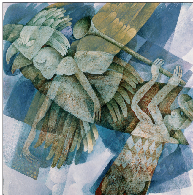
Obr. 12. Andělské troubení , 2000, kombinovaná technika na dřevě, 120x120 cm.

Training of the Sphinx , 2001, combined techniques on wood, 120x120 cm. Abrichtung der Sphings , 2001, kombinierte Technik auf Holz, 120x120 cm.