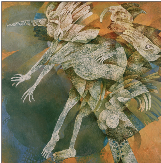
Obr. 10. Rej (Čarodějnice) , 1990, kombinovaná technika na dřevě, 120x120 cm. Whirl (Witches) , 1990, combined techniques on wood, 120x120 cm. Hexensabbat , 1990, kombinierte Technik auf Holz, 120x120 cm.

Since the end of the 1980s, especially after 1990, a considerable lightening of Svoboda’s atelier painting occurs, in comparison with his older work. A kind of colour temperance is generally maintained; however, the colouration becomes clearer, with the colours almost transparent. The creative concept tends towards a complex composition of shape in which the actual elements are often encoded and enigmatic. This