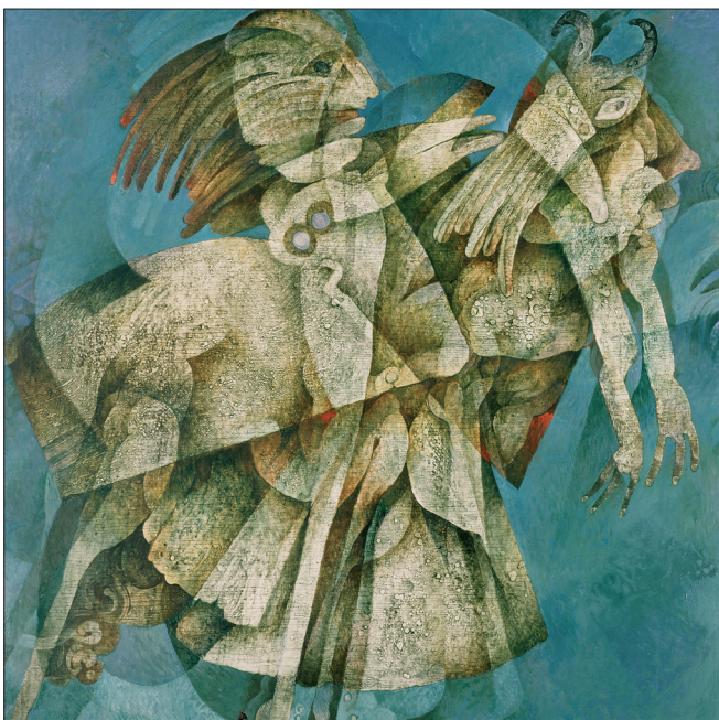
Obr. 13. Kozákova láska , 2001, kombinovaná technika na dřevě, 120x120 cm. The Cossack's Love , 2001, combined techniques on wood, 120x120 cm. Kosakenliebe , 2001, kombinierte Technik auf Holz, 120x120 cm.

Kreidegrund werden mit einer Spachtel Farbschichten aufgetragen, die einander durchdringen. Durch die reliefartige Bildgestaltung werden die summarische Umrissform des Motivs und auch die auffüllenden Details erfasst.