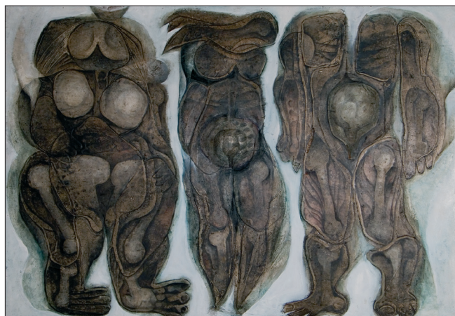
Obr. 4. Theatrum anatomicum , 1969, kombinovaná technika na dřevě, 90x120 cm. Theatrum Anatomicum , 1969, combined techniques on wood, 90x120 cm. Theatrum anatomicum , 1969, kombinierte Technik auf Holz, 90x120 cm.

cemi – výrazně prosvětlené. Barevná střídmost sice většinou přetrvává, jejich kolorit je však ve znamení jasných, téměř transparentních barev. Výtvarné pojetí směřuje ke komplikované tvarové skladebnosti, v níž jsou reálné prvky často zašifrovány a znejistěny. Proměna se dotýká i velikosti obrazů – rozměrné kompozice vystřídal střední formáty, pečlivě promalovávané, s překrývajícími se průzračnými barevnými plochami. Autorova příznačná malířská technika zůstává v podstatě nezměněna, nízký reliéf, tvořený křídlovým podkladem a barevnou hmotou, je však mnohem plošší, okem téměř nepostřehnutelný, čímž je ještě zdůrazněna důsledná plošnost malby. S velkou pozorností jsou zachycovány jednotlivé části obrazu v ploškách vytvářejících jakoby mozaiku se složitou kompoziční osnovou. Objevují se variace známých témat v novém zpracování, část s výrazným epickým nábojem