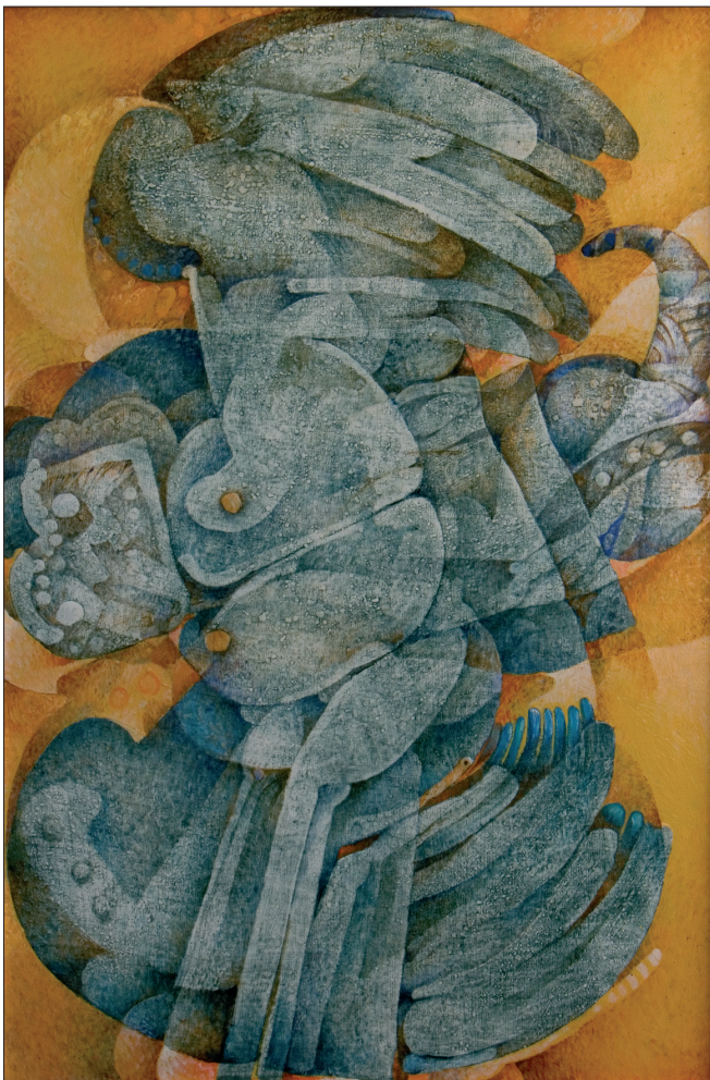
Obr. 9. Poletucha , 2002, kombinovaná technika na dřevě, 120x80 cm. Palatouche , 2002, combined techniques on wood, 120x80 cm. Flughörnchen , 2002, kombinierte Technik auf Holz, 120x80 cm.

ly endeavours to express the character of the organization or institute in which the painting is situated, working from both stylized and abstract forms as well as realistic elements in the composition of the stylized interpretation of the scene.