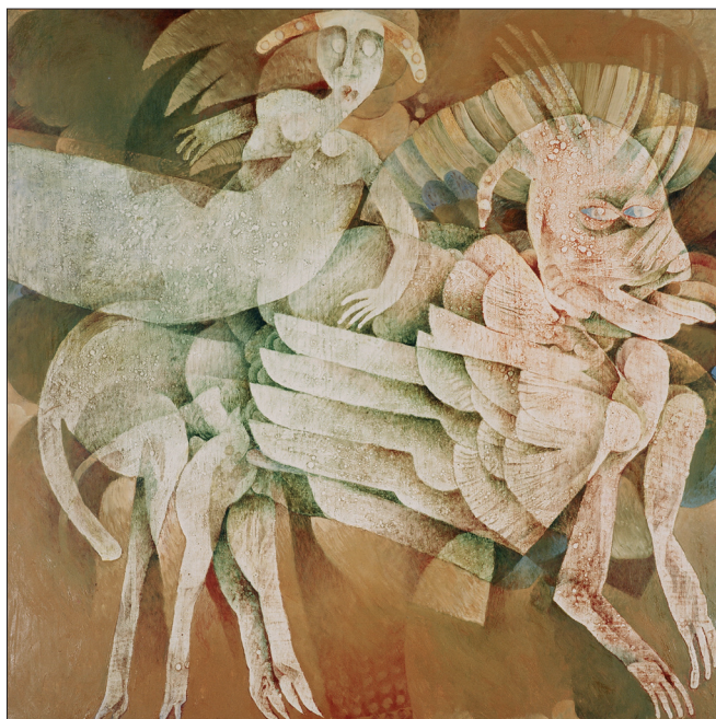
Obr. 11. Cvičení sfingy , 2001, kombinovaná technika na dřevě, 120x120 cm.

Training of the Sphinx , 2001, combined techniques on wood, 120x120 cm. Abrichtung der Sphings , 2001, kombinierte Technik auf Holz, 120x120 cm.