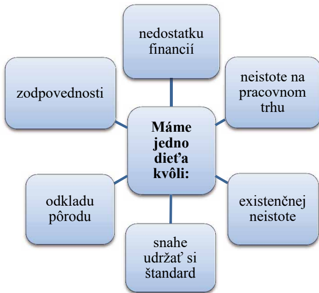
Obr. 2. Obhajoba jednodetných rodičov