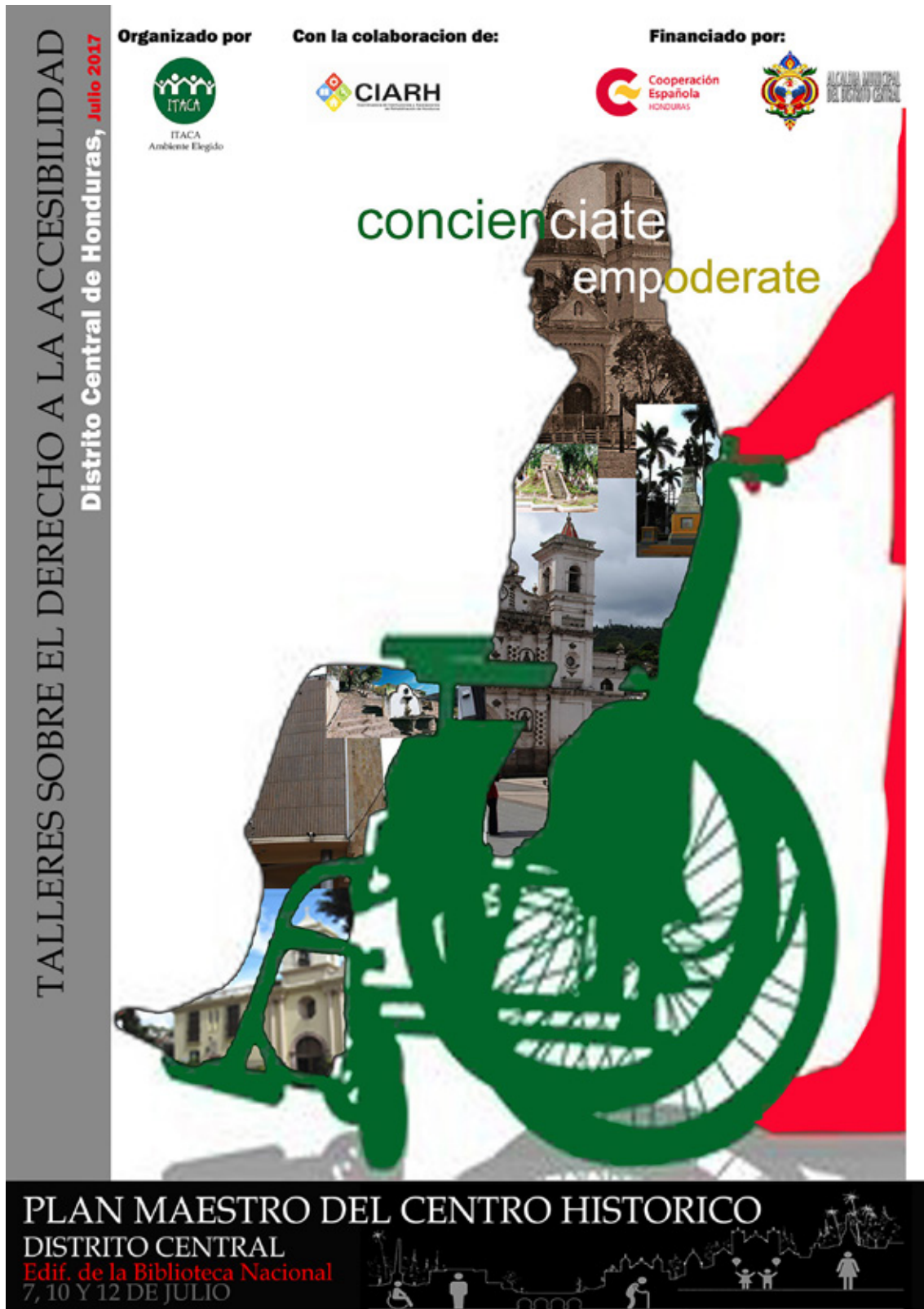
Figura 2 Cartel del taller de Discapacidad. Elaboración del autor