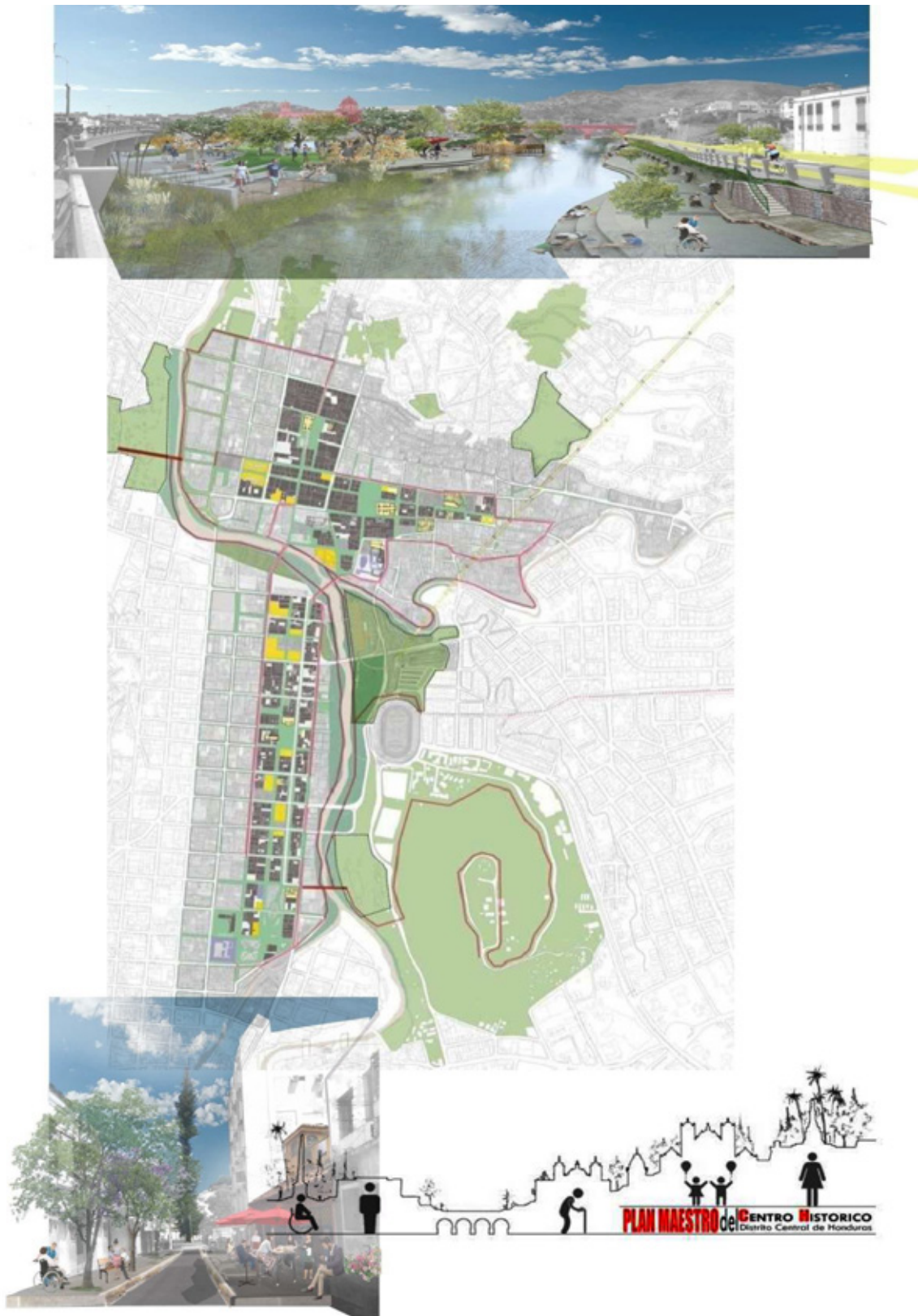
Figura 4 Propuesta de peatonalización del Centro Histórico del Distrito Central de Honduras. En verde, todas las nuevas áreas peatonales y de espacio libre propuestas por el Plan, así como fotomontajes que muestran las imágenes finales de algunas intervenciones.