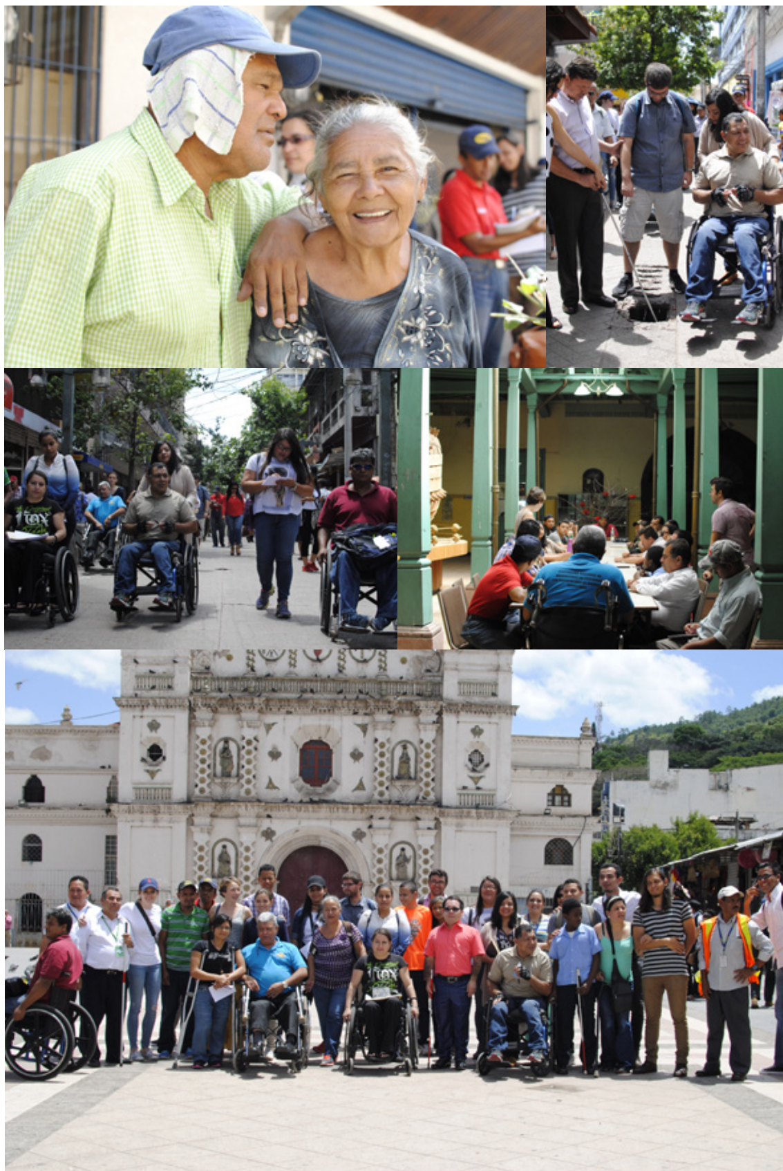
Figura 3 Imágenes que resumen las actividades del taller de discapacidad. Fuente: Plan Maestro del Centro Histórico del Distrito Central de Honduras. Autor: Antonio García.