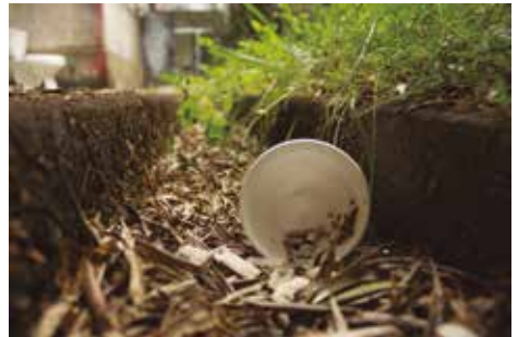
PATIO PERDIDO de Esteban Castro