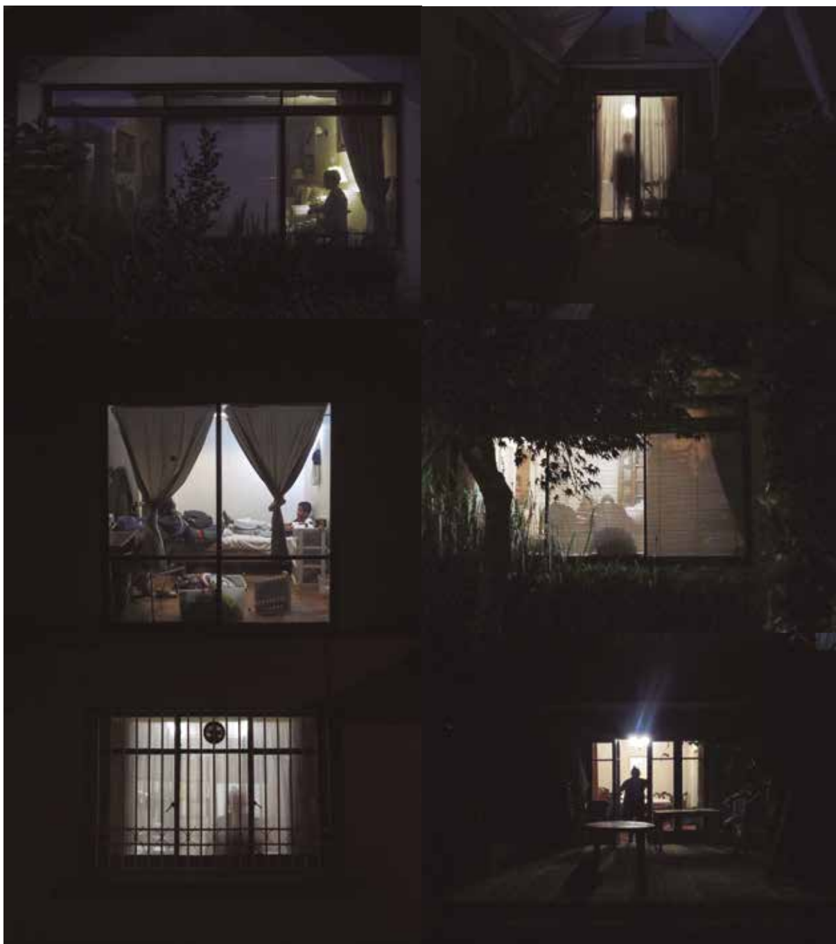
22:00 PM de Gerardo Neira