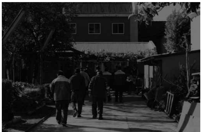
RAYUELA de Andrés Saavedra