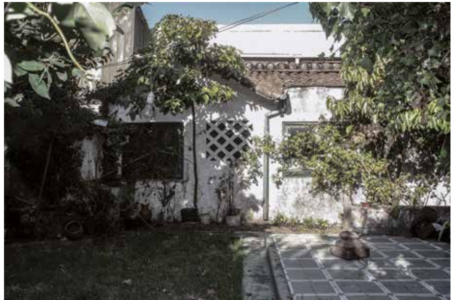
PATIO DE LAS 3 NANAS de Ricardo Prado