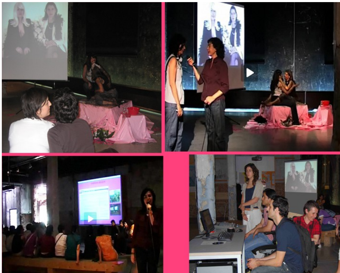
FIGURA 2: Espacio Toxic Lesbian