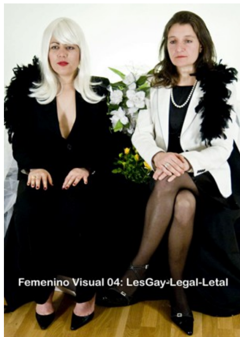
FIGURA 4: Femenino Visual

Colaboradores: Un proyecto en equipo con mujeres artistas que desarrollan su actividad en España, desde una perspectiva feminista, abordando situaciones y problemas propios de su condición. Mujeres que han trabajado y trabajan en entornos alternativos.