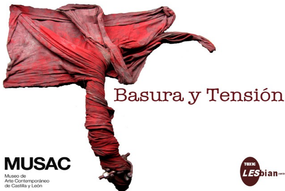
FIGURA 6: Canal Stream.

Estos nuevos soportes suponen un interesante campo de experimentación para la génesis de lo que muchos ya llaman “salones urbanos”, una suerte de lugares, no tanto físicos como sociales, que establecen un punto de encuentro y posibilidad de interacción e intercambio. Tal como apuntó Susa Pop en el Seminario sobre Pantallas Urbanas y Espacio Público celebrado en el MediaLab de Madrid en septiembre de 2009, 8 las media-fachadas nos conducen a una serie de preguntas de gran interés para el debate de lo público en lo urbano: