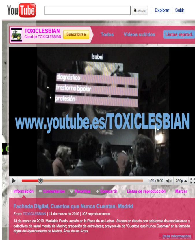
FIGURA 6: Fachada Digital en YouTube, Medialab Prado.

Colaboradores: Colectivos y asociaciones del medio homosexual y que trabajan con la salud mental.