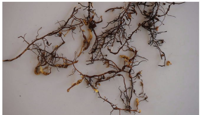
Photo 2: Galles causées par le genre Meloidogyne sur les racines de vigne (Meknès)

L'analyse nématologique a révélé l'existence des nématodes du genre Meloidogyne dans tous les vignobles prospectés (Khemissat, Tifelt, Ouled Benhamadi, Ain Taoujdate, Sebba Ayounne, Meknès, Benslimane et Bouznika). Ce genre de nématode a été rencontré dans les deux types de sols (argileux et sablonneux) avec des niveaux d'infestations élevés dépassant le seuil de nuisibilité fixé par (Mc Kenry, 1992) qui est de 20 Meloidogyne spp. par 100 cm 3 de sol. Les symptômes caractéristiques relatifs à ce genre de nématode, se manifestent par la présence des galles au niveau des racines (Photo 2). Selon Nicol et al. , (1999), plus de 50 espèces de Meloidogyne ont été identifiées sur vignes dont Meloidogyne javanica , M. arenaria , M. hapla et M. incognita sont les plus nuisibles sur cette culture.