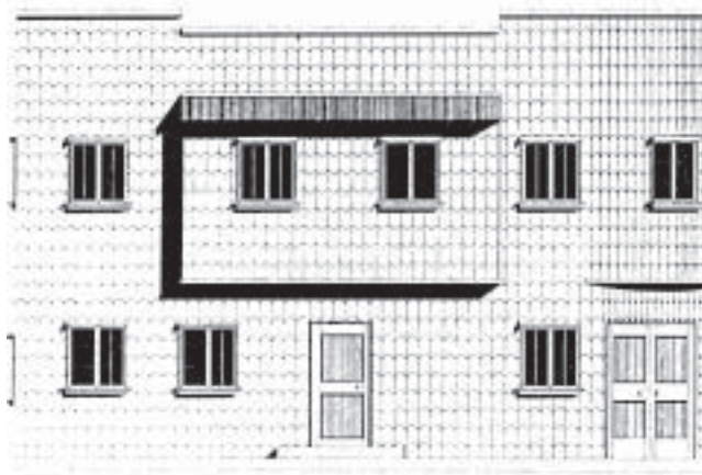
Fachada Pedro Montt 498. Castro

Lo singular de estos procesos en los nuevos entornos urbanos del sur del país, es que la Arquitectura Moderna no se reproduce en forma ortodoxa, tal cual su fuente original, sino reinterpretada, tamizada por la cultura local. Los modelos originales, prototipos del modernismo emergente por esos años, son reelaborados por la mano de obra local, con los materiales locales, utilizando una mano de obra ya experta en el trabajo de la madera, material tradicional de la zona sur del país. De este modo, de una rica tradición arquitectónica y constructiva en madera, expresada en viviendas, iglesias, estaciones ferroviarias y bodegas de madera, el sur ve surgir la arquitectura moderna en madera entre una conjunción de su propia tradición constructiva, la madera y la nueva arquitectura que irrumpe, como es la arquitectura moderna.