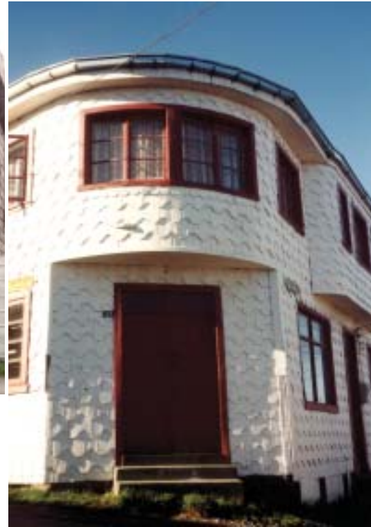
Thompson 106, Castro.

-Las diversas sub-regiones del sur aportan particularidades y especificidades al desarrollo de la Arquitectura Moderna,