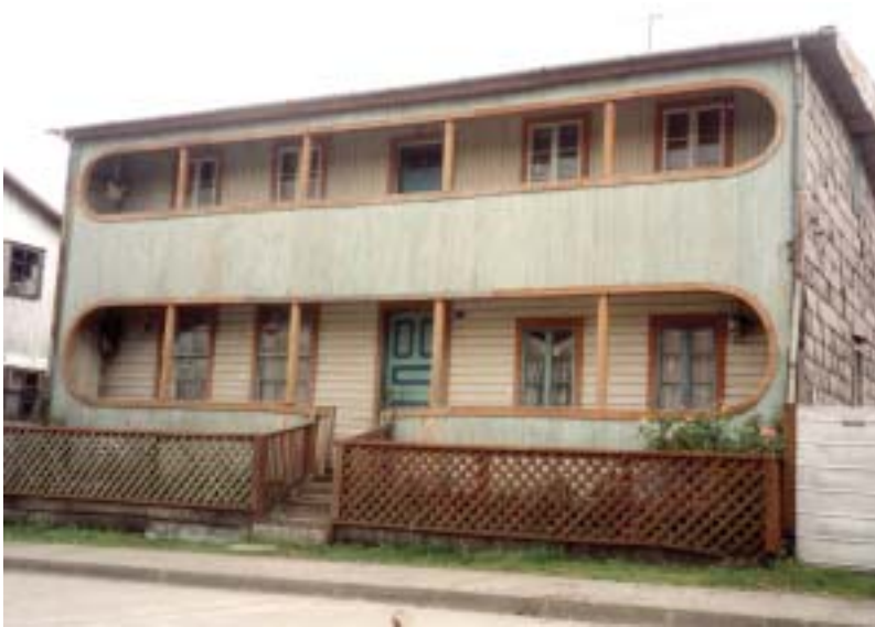
Libertad 41, Quemchi, Chiloé.

-Entre la arquitectura tradicional del siglo XIX y la arquitectura Moderna de los años 1930 hay una diferencia de tensiones: En la primera, éstas son verticales, mientras que en la segunda son horizontales.