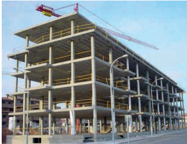
Figura 4. Ejemplo de estructura de forjado reticular