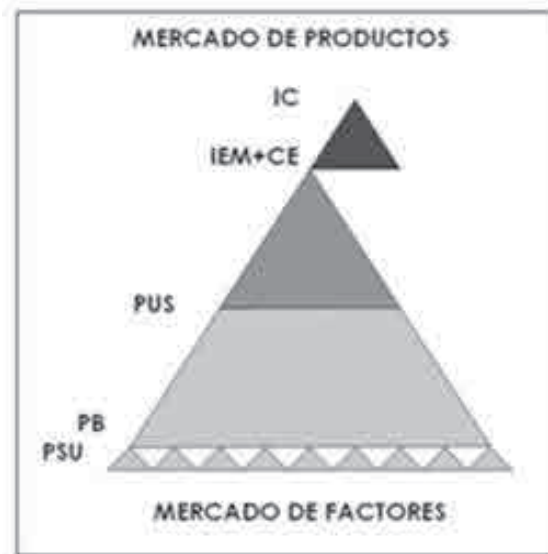
Figura 3. Pirámide de precios (Marrero y Ramírez de Arellano 2010)