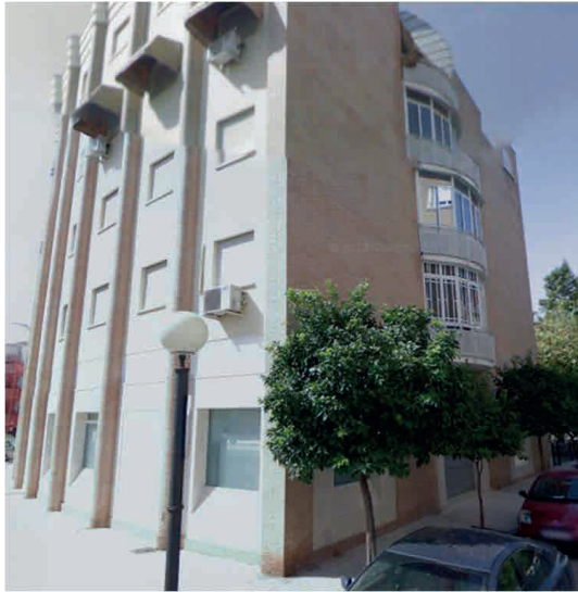
Figura 2. Imagen de viviendas dentro de la tipología modelo en el BCCA