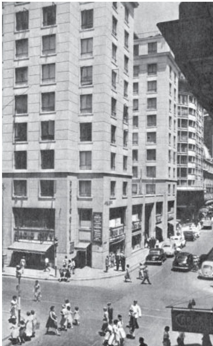
Santiago de Chile, una urbe en expansión. Años 50 del siglo XX.

Hoy día frente a las grandes concentraciones urbanas, es necesario estar de acuerdo con el cuestionamiento de De Prada 3 que se pregunta en su ensayo. "¿Qué impulsó a los hombres a fundar una ciudad si continuamente añora el campo?" El mismo se responde: "La ciudad es un fenómeno