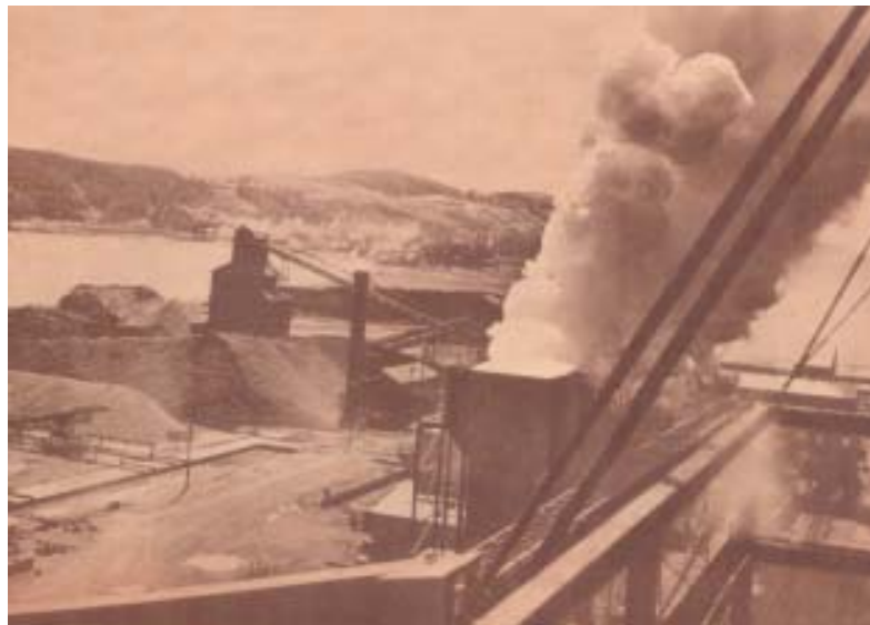
La creación de la Compañía de Acero del Pacífico en 1948 (izquierda), originó un rápido crecimiento de la población urbana. La Villa Presidente Ríos en Talcahuano (abajo), es una muestra de ello.

Este fenómeno, de un rápido crecimiento de la población urbana, superó con creces las posibilidades de manejo racional de las ciudades en el mundo entero, salvo algunas pocas excepciones. Incluso ciudades creadas artificialmente como Brasilia, no han podido solucionar esta situación que se escapa de la administración local o edilicia e incluso gubernamental. En que lo económico determina la segregación espa-