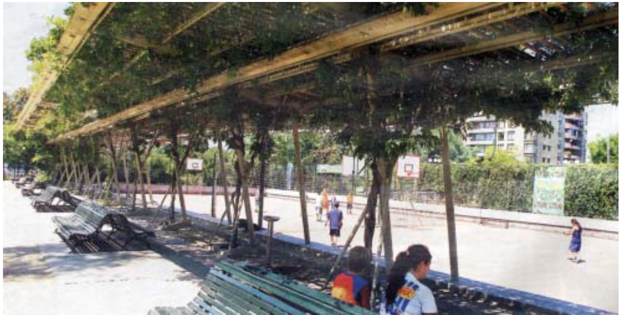
Ciudad conformada por los “llenos” (arquitectura) y los “vacíos” (espacios públicos).

toy convencido, que no vemos la fealdad. La apreciación del orden, la limpieza, la organización de las partes en un todo coherente y armónico, no es parte de nuestra conciencia tanto individual como colectiva. El detrimento del espacio urbano, también se da por la edificación. Este punto merece una atención preferencial por la cantidad de factores que concurren a esta “contaminación perceptual”