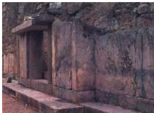
Puerta de entrada de El Castillo, estructura piramidal de posible función religiosa, ubicada en Chavín de Huantar, departamento de Ancash. Perú.

Detalle del conjunto El Palenque, en el departamento mexicano de Chiapas. Palenque proviene de un intento de reproducir en castellano la voz maya que significaba «lugar fuerte» o «de combate». Fue descubierto por los españoles en el siglo XVIII.