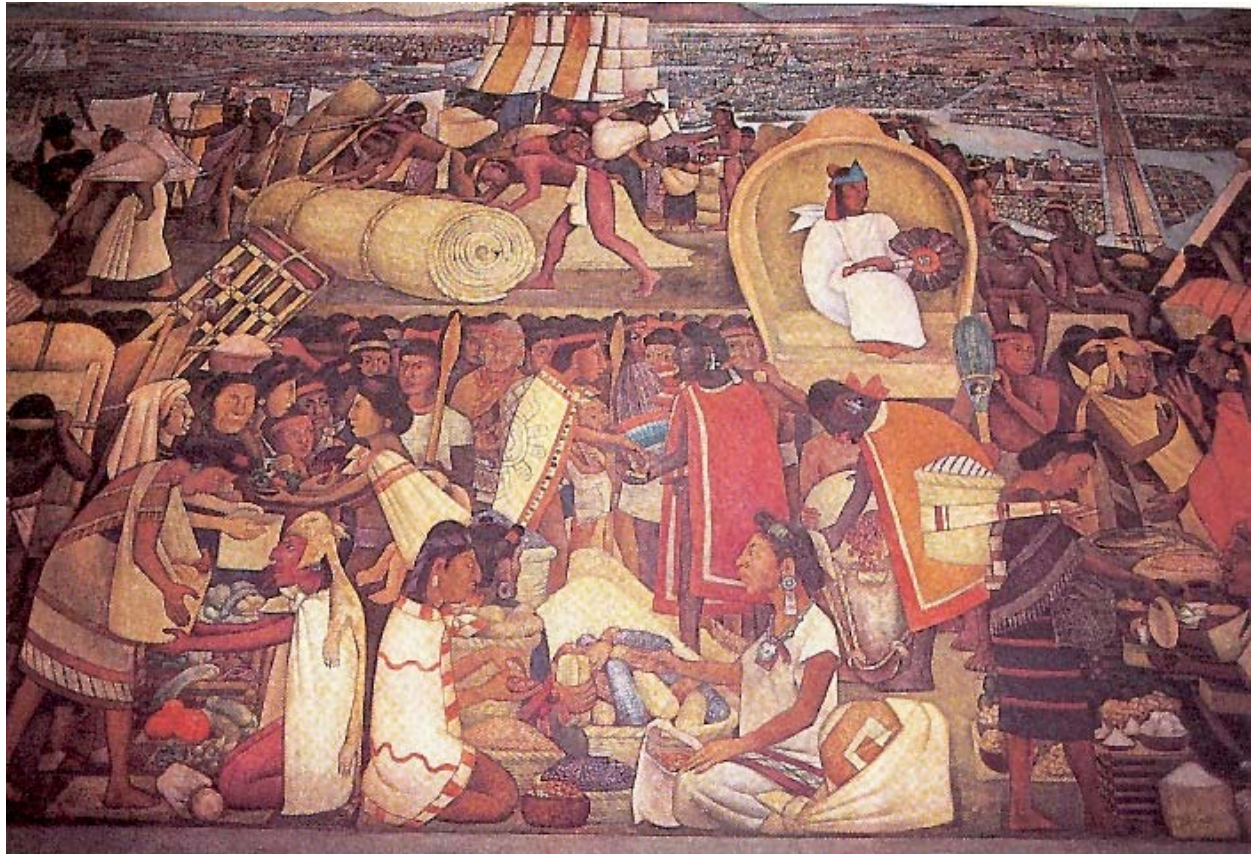
Mercado de Tenochtitlán, según un mural de Diego Rivera; uno de los frescos que decoran las paredes del palacio Nacional de México. Una masa compacta de comerciantes y agricultores abastecía a la gran población de Tenochtitlán, la que adquiría los productos necesarios por trueque o bien pagando con cacao.

lo cual se organizaron. Alguien debió ordenarlos y organizar una incipiente comunidad social bajo ciertas normas, primero consuetudinarias y después escritas. Con estos liderazgos obtuvieron poder de decisión y mando, ya sea en lo civil o en lo religioso. Esta organización con una concentración de mando y poder, muchas veces de "origen" divino, les permitió la erección de edificios tanto para esta vida como para la futura en el deseo de que se les recordase o que el camino a la eternidad fuese más llevadero y seguro. Es así, como construyeron palacios, y tumbas; monumentos que recordasen sus hazañas militares. Para llevar a cabo estas edificaciones requirieron gran cantidad de obra de mano. Como no la podían encontrar dentro de su clan en gran cantidad, ni era conveniente ya que los requerían para otras funciones especialmente de vigilancia y militar, recurrieron a la fuerza para conseguir esclavos que les sirviesen en las edificaciones y en otras obras y acciones, a veces, "no tan santas".