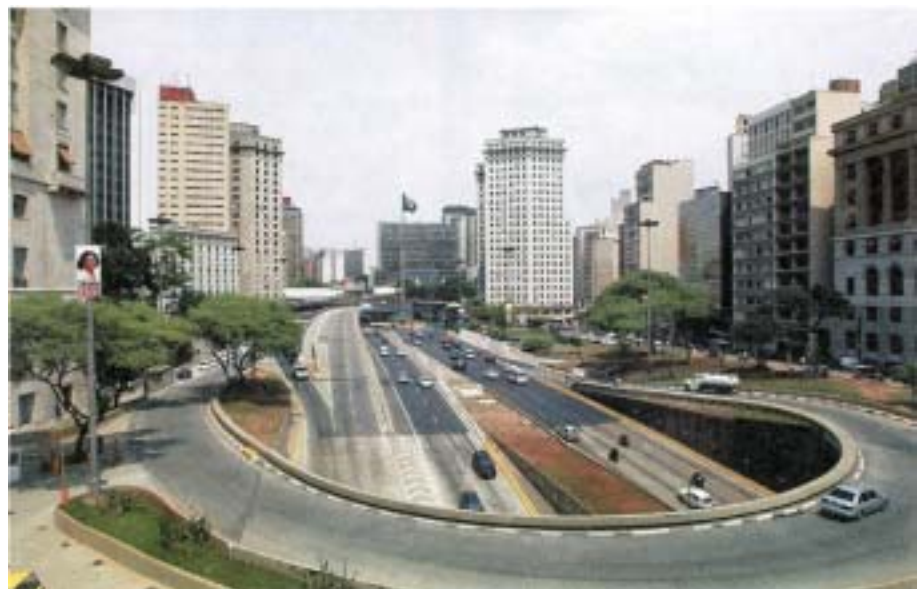
Grandes proyectos de vialidad urbana en el moderno contexto metropolitano, Sao Paulo, Brasil.

Mientras que en el enfoque de la planificación tradicional el papel del sector público es predominante, ocupando un rol rector en la formulación y ejecución de los proyectos urbanos, esta posición tiende a cambiar en la planificación estratégica. En ésta la intervención pública se desplaza de ente ejecutor hacia un papel de facilitador de la gestión de los proyectos. Así, en varios países el predominio del gobierno central ha cedido el puesto al incremento del poder de las colectividades locales y a las organizaciones de ciudadano. La descentralización complejiza más esta situación al introducir nuevos actores y reglas, generando nuevos desafíos: multiplicación de actores e intereses; atomización de los poderes; incertidumbre en la gestión urbana por la larga duración de algunos proyectos; inadaptación de los mecanismos financieros y económicos tradicionales a las nuevas condiciones que produce la desregulación y la privatización. Lo anterior invalida la pretendida función “facilitadora” del Estado.