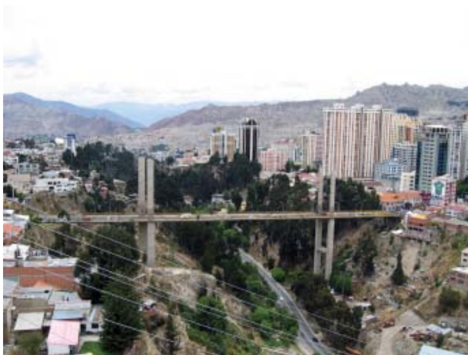
La Paz, Bolivia. La ciudad que se moderniza, salvando enclaustramientos locales.

nio histórico; contribuir a la transformación la periferia interna creando nuevas centralidades.