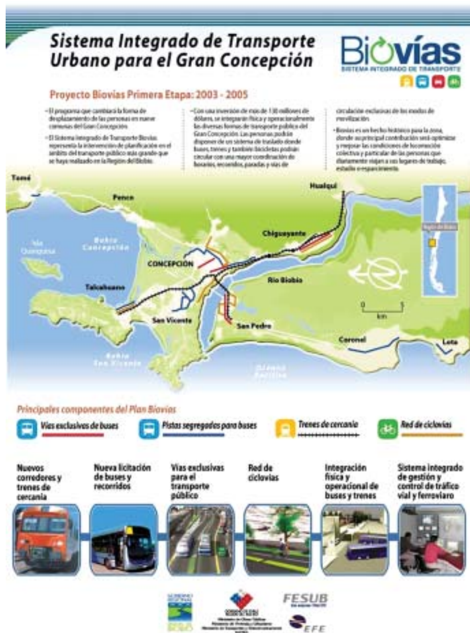
Proyecto Biovías, sistema integrado de transporte urbano, Concepción.

Plantear la construcción de una propuesta alternativa de desarrollo de las ciudades que se oponga a esta concepción neoliberal de la gestión urbana exige superar el dilema siguiente: ¿Dentro de qué modelo de desarrollo económico social y dentro de qué visión de la ciudad por construir se insertaría esta propuesta alternativa de gestión urbana? Creemos que no es posible, que es además erróneo, pretender tener una visión acabada de la sociedad y de la ciudad que se pretende construir. Sin negar la necesidad y la