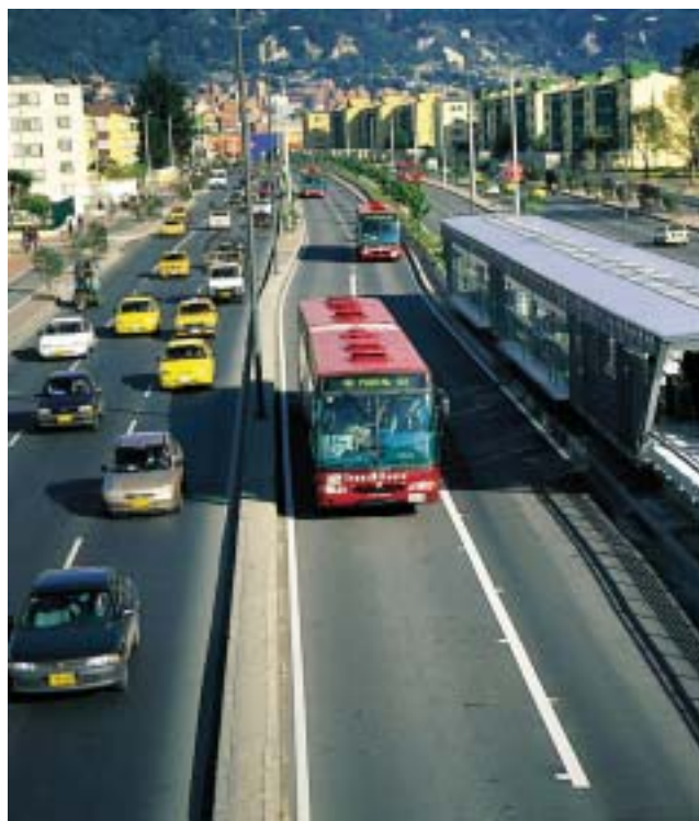
Moderno servicio de transporte urbano. Plan Transmilenio, Bogotá, Colombia.

Encontramos la expresión de este cambio en un importante documento de la Naciones Unidas, publicado la siguiente década y que sistematiza la experiencia de 10 años en el impulso de esta nueva visión de abordar los problemas urbanos. (ONU-HÁBITAT, 1986). Constatando las limitaciones de la planificación convencional frente a los cambios operados en el ámbito urbano que mostraban numerosos estudios, en los que problemas como la migración rural-urbana, la pobreza y la informalización de la economía dejan de verse sólo en sus aspectos negativos, se comienzan