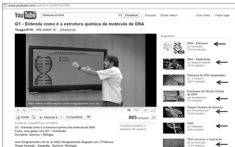
Figura 2: Vídeo aula sobre a molécula do DNA, com foco na sua estrutura. ( http://www.youtube.com/watch?v=IV2BTr6LO0Q ).

Os vídeos foram analisados quanto ao conteúdo e relevância. O primeiro selecionado foi o do Professor Thiago Azeredo que comenta sobre a estrutura da molécula de DNA, com um enfoque químico (Fig. 2). O vídeo tem duração de aproximadamente 4 minutos. Na figura 2, as setas em vermelho indicam os vídeos relacionados ao termo procurado.