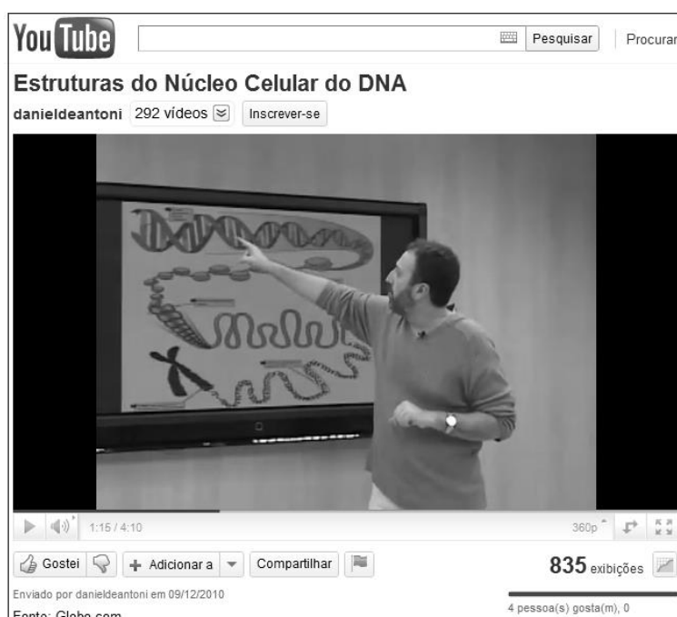
Figura 3: Vídeo aula sobre as estruturas do núcleo celular. ( http://www.youtube.com/watch?v=81mtMjzNJTg&feature=related )

Outro vídeo aula selecionada é a do professor de biologia Durval Barbosa. O vídeo tem aproximadamente 4 minutos e trata das estruturas do núcleo celular e consequentemente do DNA (Fig. 3).