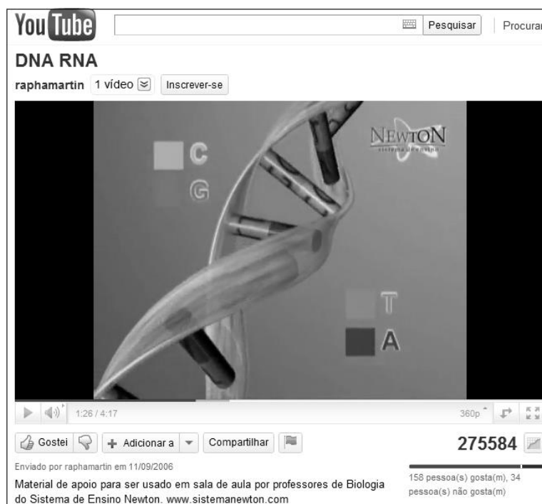
Figura 6: Animação sobre a molécula do DNA e RNA. Se encontra disponível em: ( http://www.youtube.com/watch?v=yZ_IPafioSU&feature=related )

Este vídeo (Fig. 6) é um material que chamou bastante atenção pelo elevado número de exibições quando comparado com todos os demais vídeos sobre a molécula de DNA apresentados neste trabalho. Analisando o vídeo, pode-se notar que é um material rico em imagens coloridas em movimento, demonstrando o processo de replicação e transcrição do DNA até a produção de proteína. Apesar deste vídeo ser de ótima qualidade visual, requer que um professor de biologia esteja mediando a aplicação deste material, pois o mesmo ficou pouco explicativo, faltando informação sobre os componentes envolvidos no processo.