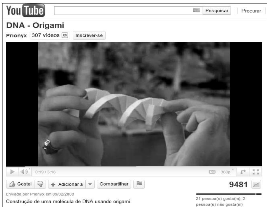
Figura 7: Vídeo de demonstração da construção de uma molécula de DNA usando Origami. ( http://www.youtube.com/watch?v=31q4ze2fWA4 )

Existe ainda a possibilidade de se editar esses vídeos, incluindo anotações, balões de fala, pausa e links para outros vídeos fazendo com que o aluno não seja somente aquele que assiste ao vídeo, mas sim aquele que modifica o seu conteúdo.