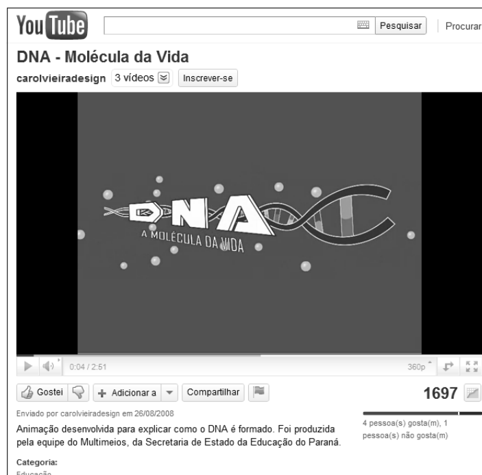
Figura 4: Animação sobre a estrutura do DNA. Disponível em: ( http://www.youtube.com/watch?v=U2_JlichsY&feature=player_embedded ).

animação muito rica sobre a estrutura do DNA, onde é possível observar uma viagem do mundo macroscópico para o mundo microscópico ao nível do DNA.