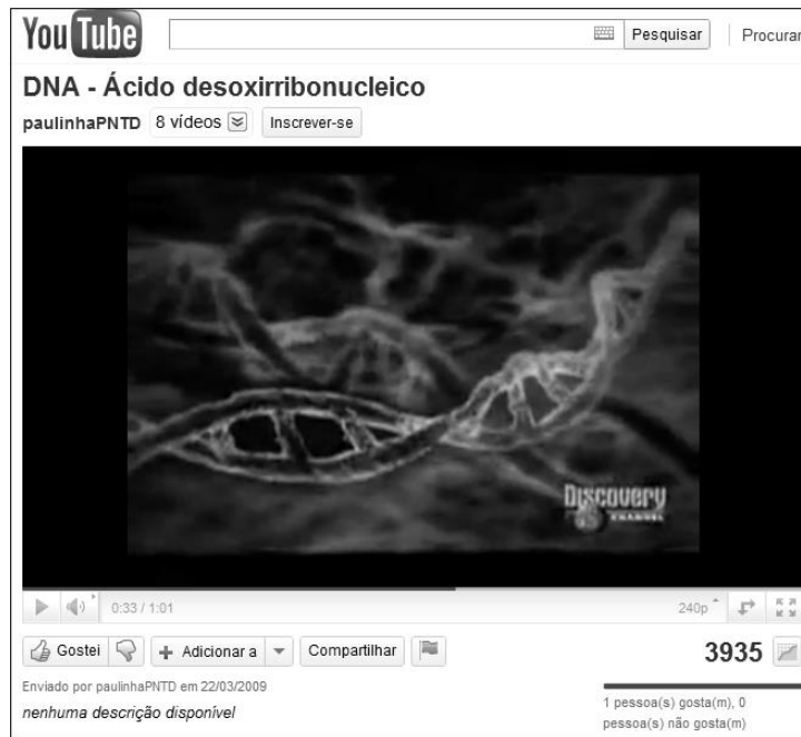
Figura 5: Animação sobre a estrutura do DNA. ( http://www.youtube.com/watch?v=p_AtV2f-I9c ).

Este vídeo (Fig. 5) tem um número maior de exibições que os representados pelas figuras 2, 3 e 4, possivelmente por ser proveniente de um canal conhecido, mas não significa que as informações contidas nele sejam seguras. Independente da origem do material o professor deve analisar os vídeos antes de passá-los aos seus alunos. Neste vídeo ocorre uma falha logo no início, informando que ocorre uma fusão entre óvulo e esperma e na verdade ocorre uma fusão entre óvulo e espermatozoide. Segundo MERCADANTE e colaboradores (2005), a união entre o espermatozoide e os líquidos seminais proveniente da próstata e da vesícula seminal forma o esperma (ou sêmen).