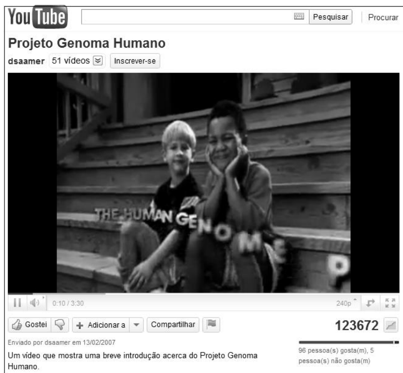
Figura 8: Demonstração do comportamento dos genes promovendo as diferentes características. ( http://youtu.be/Bu6rbC2cnTM )

Todos estes vídeos tentam demonstrar a estrutura do DNA em um formato 3D para uma melhor compreensão desta complexa estrutura. É impossível observar o DNA a olho nú e em microscópio óptico. O DNA é formado pela união de duas fitas, cada fita é formada pela união de nucleotídeos, nas extremidades dos nucleotídeos são onde ocorre as ligações, o nucleotídeo é formado por um fosfato, uma pentose e uma base nitrogenada. Os fosfatos se ligam formando os dois lados da fita de DNA e essas fitas se ligam pelas bases nitrogenadas, que são: Adenina, Timina, Citosina e guanina e a sequência dessas bases formam o código genético (AMABIS e MARTHO, 2004).