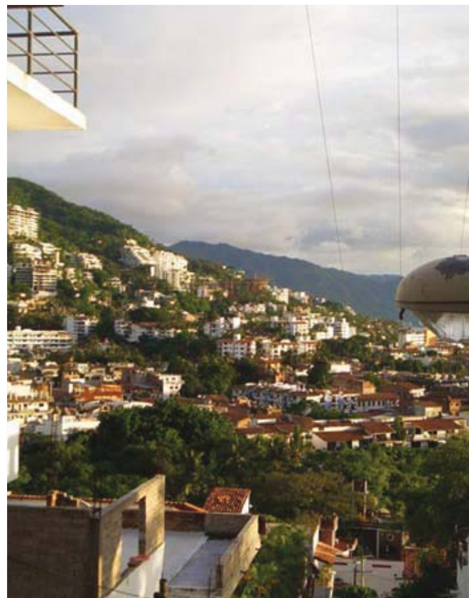
La expansión que la ciudad experimenta hacia la periferia ocupa suelos de mayor vulnerabilidad donde, en parte, se asienta también un porcentaje alto de población inmigrante, sin identidad urbana y con mayor riesgo social.

impulso a la segunda vivienda de calidad turística (condominios, departamentos, tiempo compartido, casas, villas y cotos), sin embargo el costo de la vivienda en los últimos 8 años ha aumentado entre un 35 y un 42 % en términos de su costo directo, lo que afecta esencialmente el precio de las rentas y adquisición de vivienda de la población local, que se ve forzada a la invasión ilegal de terrenos, la autoconstrucción o la adquisición de vivienda, mediante los créditos de viviendas que se producen con el traslado del crédito oficial para la construcción popular de vivienda de dudosa calidad estructural y ambiental, dados los sitios donde se asientan y los servicios que les envuelven.