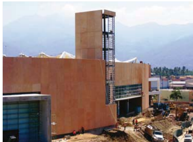
Un extenso paño de suelo con vegetación nativa se constituye en un mercado de tierra especulativa, la que finalmente se transforma en desarrollos inmobiliarios y expansión de grandes tiendas comerciales.

“un mercado de tierras especulativo, que atenta contra la población local, que deja sin posibilidades competitivas financieras para invertir en ese negocio a los inversionistas nacionales. La ocupación masiva que exige este modelo provoca altos costos del suelo que son incompatibles con el desarrollo turístico sustentable y con la capacidad de reinversión a los habitantes. Los impactos ambientales son fruto de un desarrollo sin control, de un modelo sin compromiso social y de un sistema dominado por la especulación económica”. (Fonatur, 2000), sin los controles necesarios para un desarrollo con equilibrio social y ecológico. En tal sentido el crecimiento de los grupos de visitantes por escala de empleo e ingresos, mide y a su vez se refleja en una modificación en la estructura en los niveles económicos, estrato social y educativo del turismo que llega y los días de permanencia, tanto nacional como internacional. “El cambio de los turistas de un grupo mayoritario de clase media alta a alta y su reemplazo por un grupo de nacionales y extranjeros de clase media baja a baja, se expresa también en términos educativos, y esta síntesis de baja cultura y nivel económico, nos muestra un perfil de visitante de un lugar maduro y el comienzo del deterioro”. (Fonatur, 2000).