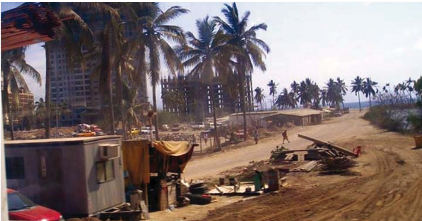
El litoral del “triángulo de Oro” de los estados de Jalisco, Colima y Nayarit, se ha movido en los últimos años con gran dinamismo hacia la construcción de edificios y torres que han transformado la línea del paisaje costero.

En este proceso, la conurbación de Nuevo Vallarta, territorio del Municipio de Bahía de Banderas, Nayarit, viene sumando complejidad al problema ya que las flexibles o ausentes normativas provocan una peligrosa inestabilidad en los diferentes órdenes de su crecimiento y desarrollo. Allí la mayor parte de las viviendas que acogen a los nuevos pobladores y la vivienda de reserva, ha convertido a las antiguas poblaciones de San Juan de Abajo, San Vicente y San José, en una especie de pueblos dormitorio. Allí también se ha instalado un mercado de segunda propiedad para grupos de capacidades menores de inversión. Tal estado de cosas marca un estado de emergencia para el sitio. El fenómeno se considera de alta dificultad y se remonta solo a más o menos dos décadas. El proceso gradual de cambio en la forma de alojamiento-consumo, la derivación de la renta del turismo, convertida en una nueva oferta, comienza a afectar todo el esquema del espectro turístico: la promoción del sector