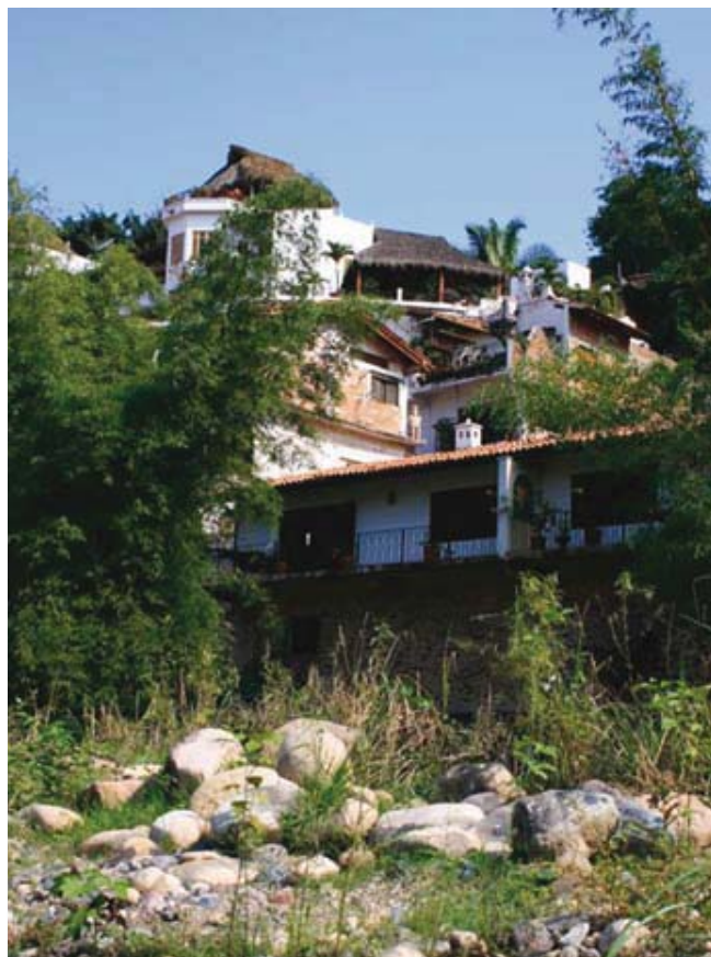
Desarrollos turísticos cercanos a Puerto Vallarta de microcauses fluviales que involucran zonas protegidas y de riesgo. Rio Cuale.

Mascota y Mismaloya, además de arroyos permanentes como el Camarones, Santa María y el Nogal; y otros temporales, como el Palo de Santa María y el Agua Zarca. El estero El Salado es de suma trascendencia en este sentido, requiriéndose con urgencia una propuesta que contenga una visión experta del medio natural y de su uso social que pretenda superar las contingencias hasta ahora acumuladas. Todo ello en un marco de impulso cultural que ejerza una influencia positiva para el futuro de Puerto Vallarta.