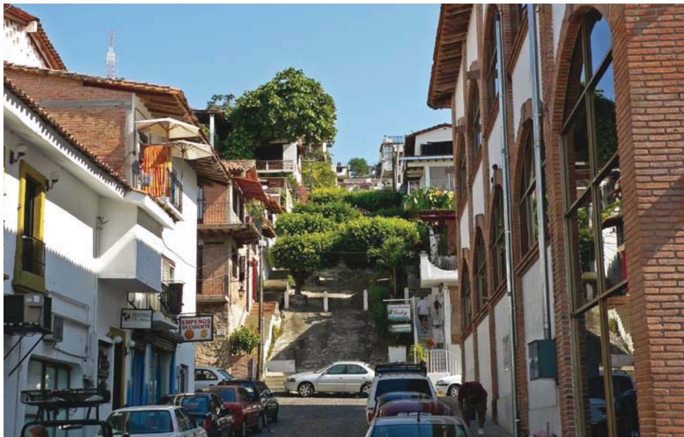
El reciente desarrollo turístico de Puerto Vallarta se expresa a partir de una agresiva y dinámica política de expansión urbana que convoca fuertes intereses locales y externos en la participación de proyectos inmobiliarios.

disfrutaba un reducido grupo de personas relativamente acomodadas a comienzos del siglo recién pasado, que hacia la mitad había aumentado considerablemente, pero que se convirtió en los años 70 y sobretodo en los ochenta, los de la denominada “década perdida”, en un fenómeno de masas en los países más desarrollados, accesible actualmente a grupos más amplios de gente en la mayor parte de los países desarrollados y los que le siguen en la escala del desarrollo económico. “Para ilustrar este hecho, las llegadas internacionales de turistas pasaron de 25 millones en 1950 hasta 698 millones en 2000, con una tasa media de crecimiento anual del 7%.... Después de los ataques del 11 de septiembre y de la baja en las cifras del turismo internacional en 2001, las estimaciones preliminares del turismo en el año 2002 constituyen una sorpresa para muchos. Por primera vez en la historia, el número de las llegadas turísticas internacionales ha rebasado la frontera de los 700 millones”, según la más reciente cifras de la Organización Mundial de Turismo, los números rondan los ochocientos millones.