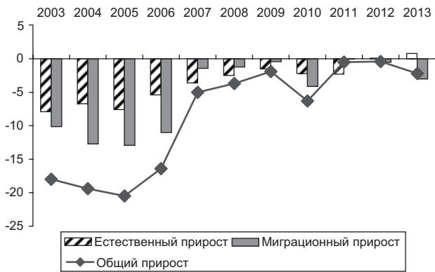
Рис. 2. Компоненты изменения численности населения Хабаровского края (в промилле)

Демографический потенциал территории определяется не только действием таких динамических факторов, как рождаемость, смертность, продолжительность жизни. К демографическим компонентам относится и миграция. От масштабов и взаимодействия этих факторов зависит динамика населения. Значения этих компонентов в демографической динамике Хабаровского края, как и Дальневосточного федерального округа (ДФО), неоднократно менялись.