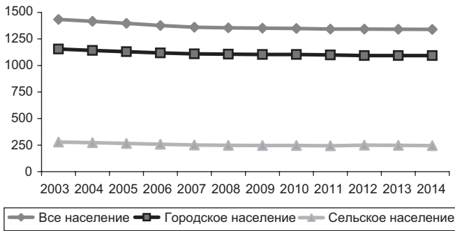
Рис. 1. Изменение численности населения Хабаровского края (на 1 января; человек)

Демографический потенциал территории определяется не только действием таких динамических факторов, как рождаемость, смертность, продолжительность жизни. К демографическим компонентам относится и миграция. От масштабов и взаимодействия этих факторов зависит динамика населения. Значения этих компонентов в демографической динамике Хабаровского края, как и Дальневосточного федерального округа (ДФО), неоднократно менялись.