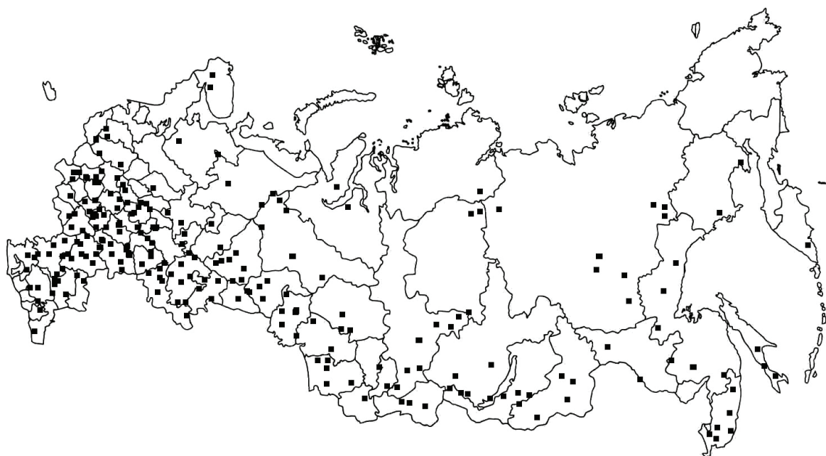
Рис. 2. Расположение организаций высшего образования на карте Российской Федерации *

показано расположение организаций высшего образования на карте Российской Федерации.