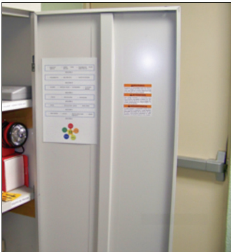
Figura 2. Salida de emergencia en incumplimiento con norma.

Respecto a los niveles 2 y 3, las rutas de evacuación cumplieron con lo establecido por los términos de referencia y las listas de verificación antes mencionadas; sin embargo en los señalamientos hubo ligeros cambios debido a que no cumplían con lo establecido en la normativa. Ejemplo de esto son las alturas de colocación, lugar de ubicación, colores de señalamientos, claridad en las imágenes, por mencionar algunos. Otra de las directrices con las cuales no cumplían la normativa los niveles 2 y 3 fueron las salidas de emergencia, debido a que la norma establece que las salidas de emergencia no deben estar obstruidas por objetos (Figura 2), también prohíbe que las salidas se encuentren bloqueadas por cerraduras.