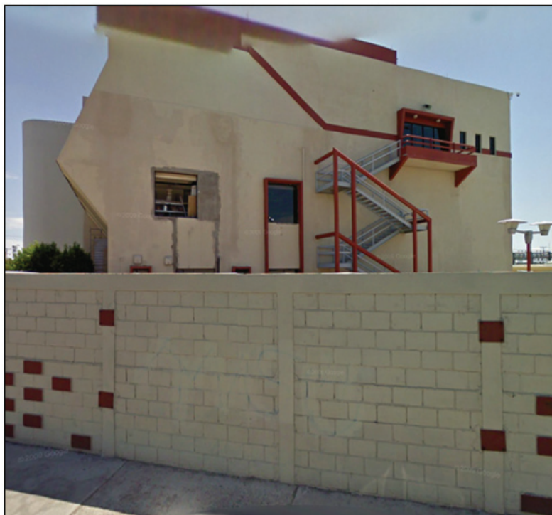
Figura 3. Instalación de salida de emergencia de tercer nivel.

La realización de esta propuesta surgió debido a un incendio en una de las oficinas del primer nivel, provocado por una falla eléctrica (corto circuito), el cual generó pánico y descontrol entre las personas, obligándolas a buscar la salida más próxima, sin embargo el personal situados en los niveles dos y tres se vieron obligados permanecer en el área hasta ser auxiliados por los equipos de seguridad establecidos en dicha institución. Al final del accidente ninguna persona sufrió daño alguno, afortunadamente esta contingencia solo trajo pérdidas económicas para la empresa.