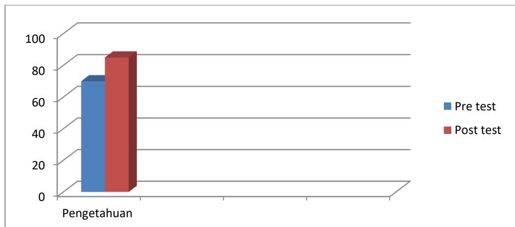
Diagram tingkat pengetahuan

Setelah dilakukan pre test kegiatan selanjutnya adalah menyampaikan materi penkes. Peserta penkes tampak konsentrasi, aktif dan tidak meninggalkan ruangan selama kegiatan penkes berlangsung.