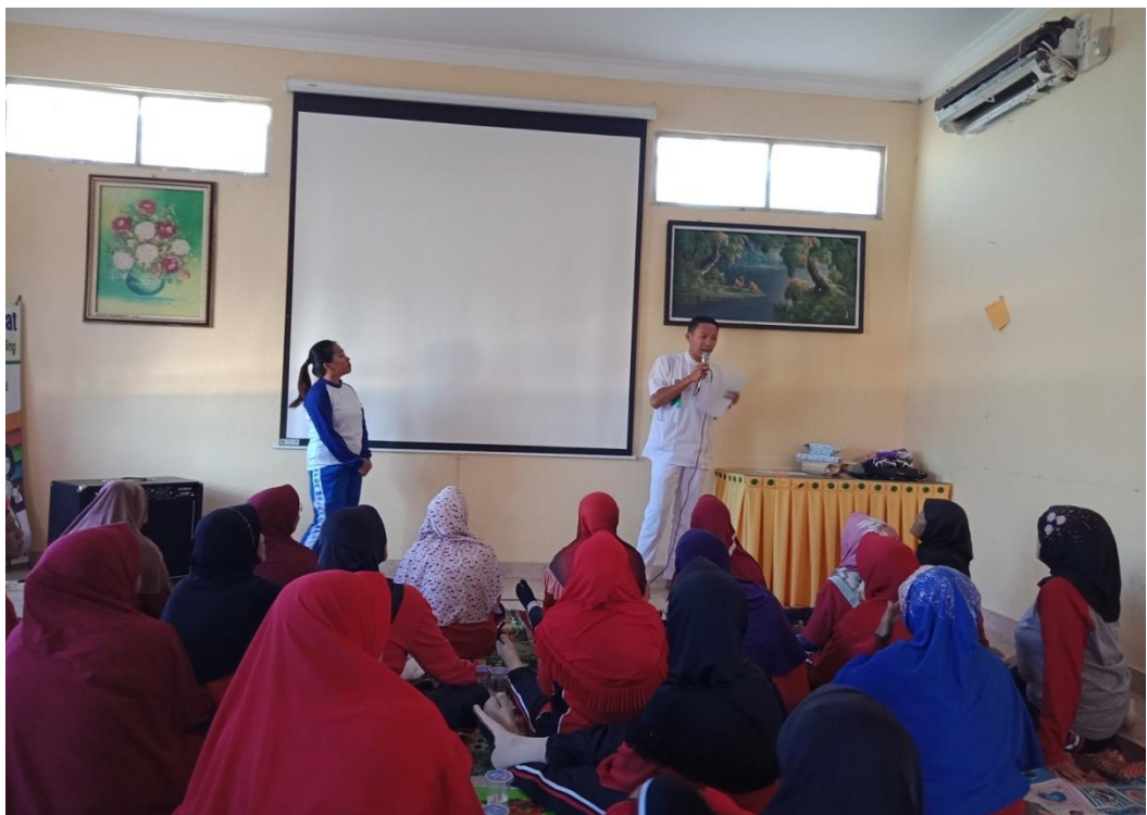
Gambar 2 : diskusi dan tanya jawab tentang materi penkes

Setelah penyampaian materi dilakukan post test dengan cara wawancara kelompok adapun hal- hal yang kami tanyakan saat post test adalah :