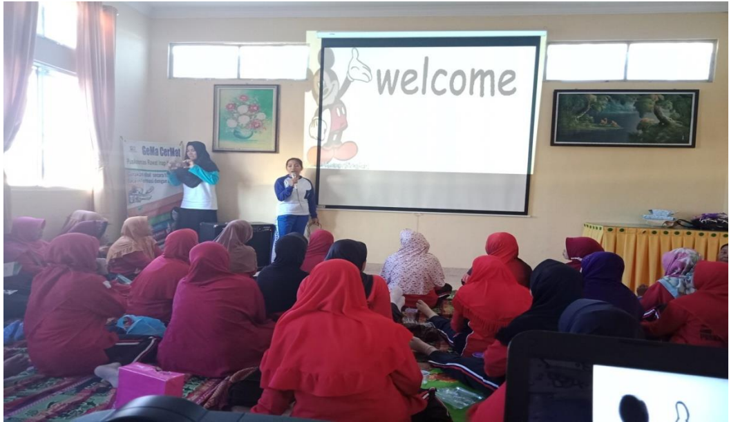
Gambar 1 : penyampaian materi penkes