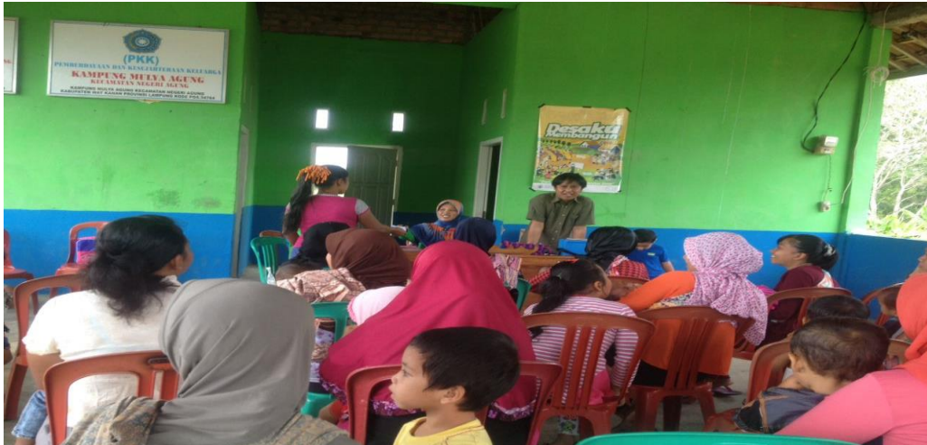
Gambar 4.1. Penyuluhan dan Senam Lansia Penderita Rematik Lansia