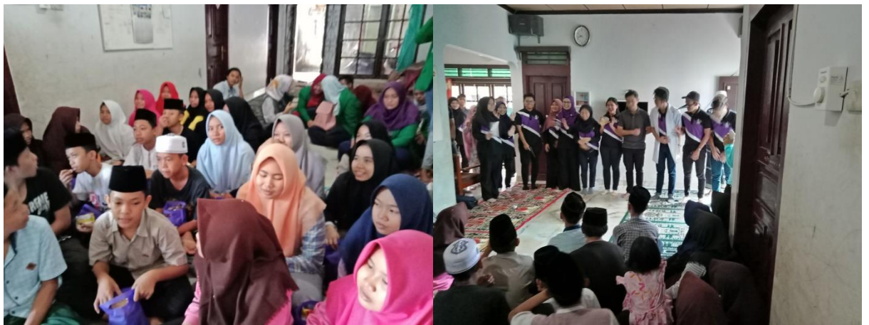
Gambar 4. Roleplay Mahasiswa UPM tentang Nyamuk dan Lingkungan