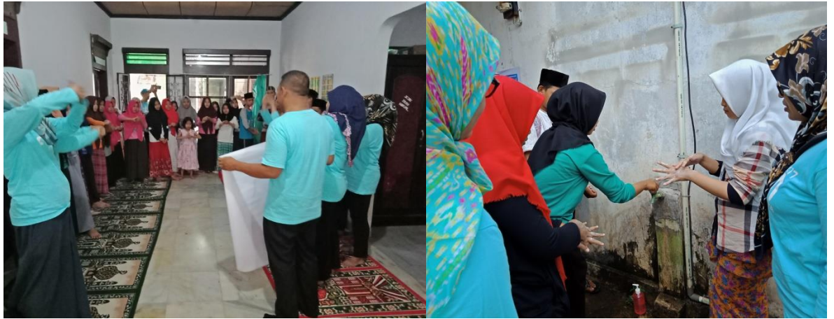
Gambar 3. Pelaksanaan Edukasi Cuci Tangan