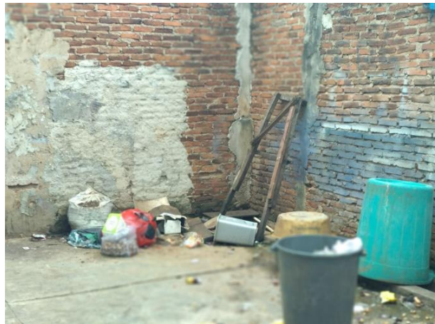
Gambar 1. Gambaran Situasi Lokasi Penelitian

Hasil survei pendahuluan yang dilakukan melalui observasi dan wawancara dengan pengurus panti asuhan didapatkan bahwa terdapat masalah kebersihan lingkungan seperti belum adanya pemanfaatan kotak sampah dengan baik sehingga sampah menjadi berserakan, tidak ada tempat cuci tangan, dalam satu ruangan terdapat 6 tempat tidur yang tidak ada kelambu dan kurangnya pengetahuan anak panti dan staff tentang pentingnya Perilaku Hidup Bersih dan Sehat (PHBS). Berdasarkan temuan tersebut tujuan kegiatan ini adalah memberikan edukasi mengenai PHBS yang melibatkan mahasiswa FKM dan UPM.