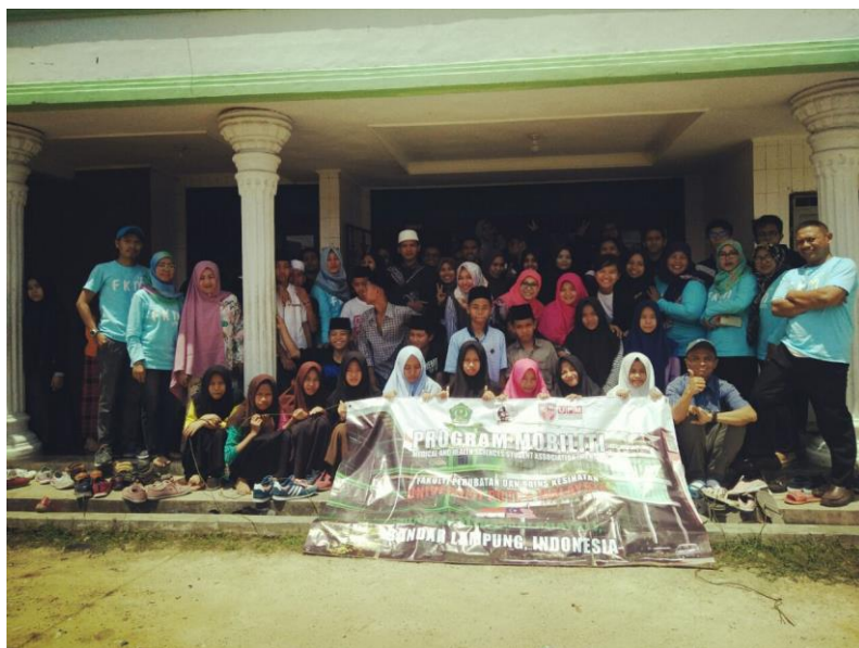
Gambar 5. Pelaksanaan Edukasi PHBS