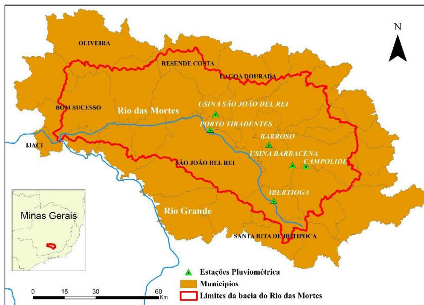
Figura 1 - Localização das estações pluviométricas

** - Inverso do quadrado da distância da respectiva estação em relação à estação Usina Barbacena.