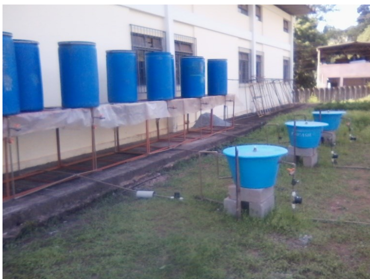
Figura 1 - Esquema dos recipientes interligados aos biodigestores.

Cada conjunto de três recipientes, foi interligado a um biodigestor, conforme a Figura 1. Foi denominado de Sistema 1 um conjunto de três recipientes com apenas rejeito, interligados no biodigestor B1. De Sistema 2 (3 recipientes contendo 60% de matéria orgânica, 20% de rejeito e 20% de reciclável, interligados ao biodigestor B2) e Sistema 3 (3 recipientes com 30% de matéria orgânica, 35% de reciclável e 35% de rejeito, interligados ao biodigestor B3).