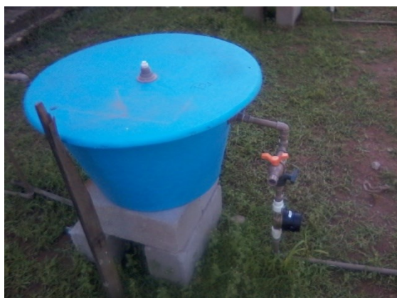
Figura 2. Biodigestor tampado

Os biodigestores foram tampados de modo a vedar a caixa para as reações anaeróbias (Figura 2).