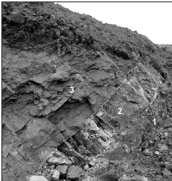
Obr. 2: Antonínské souvrství v 2 m vysokém zářezu sz. břehu budovaného rybníka: 1 – šedý a hnědošedý vápenný jíl (vzorek BM001A), 2 – světle šedý kalový vápenec (vzorek BM001C), 3 – hrubozrnný vápenný pískovec (vzorek BM001D).

1) světle hnědošedý vápenný jíl přecházející do šedého slabě vápenného jílu (Te interval turbiditního rytmu a hemipelagit; vzorek BM001A),