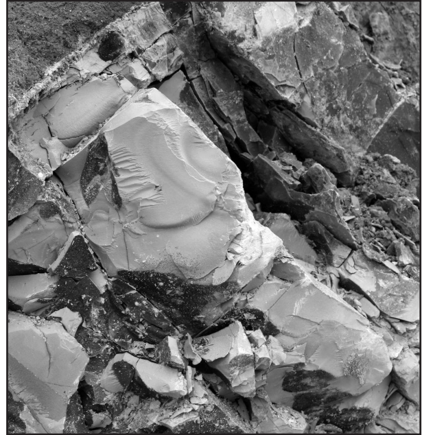
Obr. 3: Detail světle šedého kalového vápence, viz obr. 2. Fig. 3: Detail of light grey limestone – mudstone, see fig. 2.

Fig. 2: Antonín Formation in the 2 m high northwestern cut of pond under construction: 1 – grey and brown-grey calcareous clay (sample BM001A), 2 – light grey limestone – mudstone (sample BM001C), 3 – coarse-grained calcareous sandstone (sample BM001D).