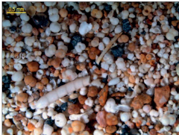
Obr. 3: Společenstvo foraminifer z vápničných jííl. Fig. 3: Assemblage of foraminifers from calcareous clays.

celkového trendu růstu relativní hladiny. Detailnější odlišení systémového traktu ve smyslu sekvenční stratigrafie vyžaduje širší srovnání.