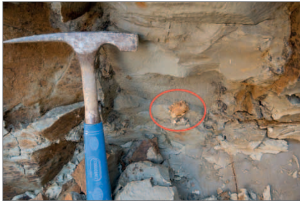
Obr. 5: Fragmentovaná miska ústřice druhu Neopycnodonte navicularis (Brocchi, 1814) ve vápnitých jílech spodního badenu. Autor M. Bouška.

Fig. 5: Fragmented test of oyster Neopycnodonte navicularis (Brocchi, 1814) in calcareous Lower Badenian clays. Author M. Bouška.