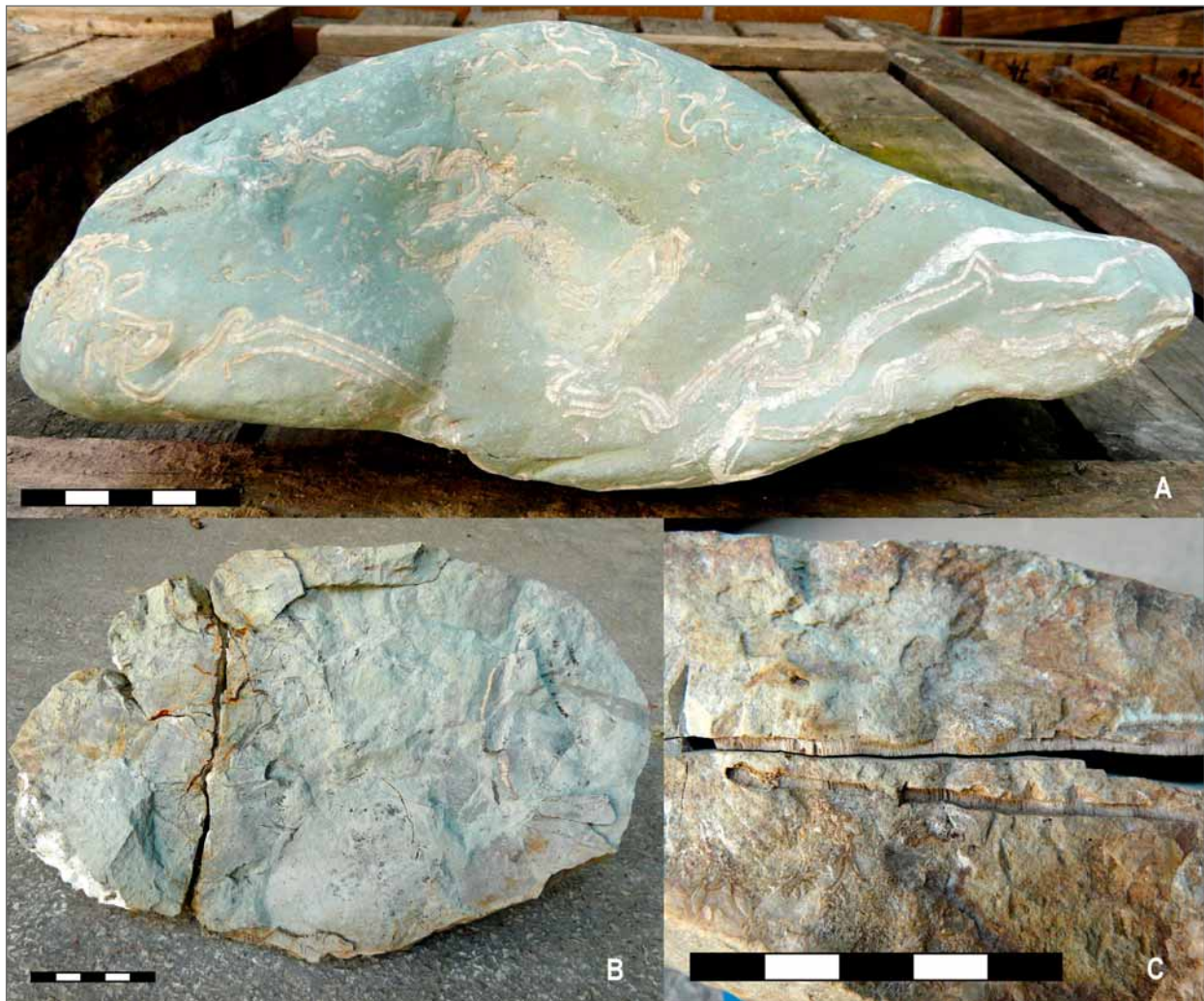
Obr. 3: Inoceramidní mlži Platyceramus sp. z campan–maastrichtu podslezské jednotky v Kopytné: A – deformovaní artikulovaní jedinci v konkraci slínovce z náplavu Kopytné; B – nekompletní miska v rozštíplé konkraci, MB128; C – tentýž kus, detail příčného lomu oběma miskami. Měřítko = 5 cm.

Vedle řady blíže neurčitelných zástupců rodu Recurvoides byly ojediněle identifikovány následující druhy: v jílech cenomanu–coniacu Recurvoides cf. imperfectus (Hanzl.) a R. recurvoidiformis (Neagu et Toc.); ve vápničitých