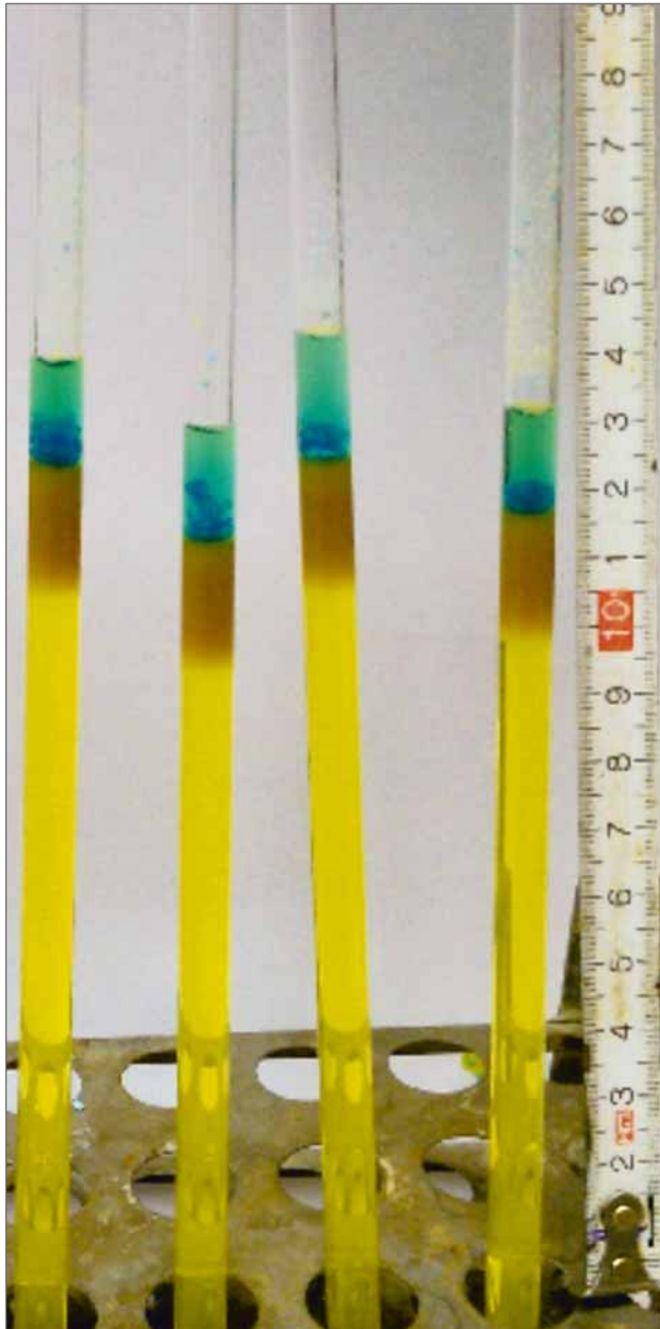
Obr. 1: Fotografie založení experimentu v kolonách o výšce 16 cm. Fig. 1: Photos of experimental setup in columns with a height of 16 cm.