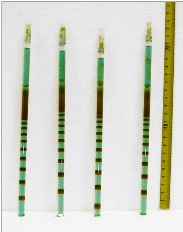
Obr. 3: Fotografie vzniku pravidelných pásků v kolonách o výšce 16 cm, 1 008 hodin po zahájení difúze.