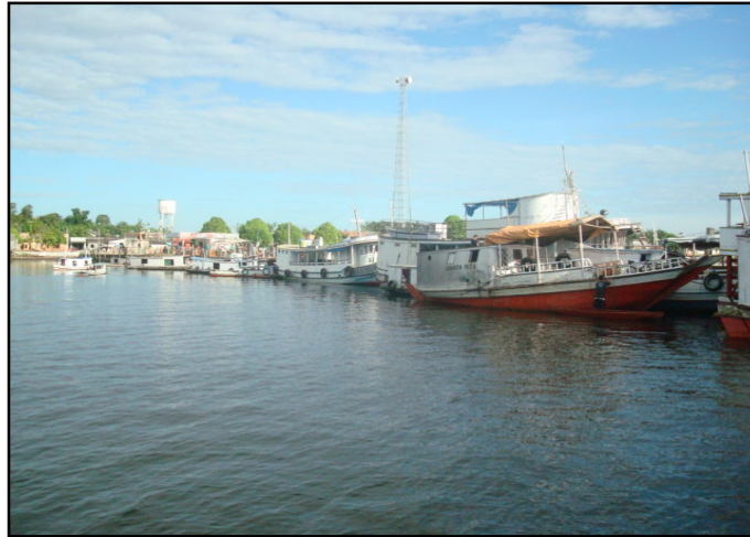
Figura 2: Antena da Embratel em Melgaço-Pa, Joel Silva, 2010.

O acesso a linhas telefônicas, transmissões de rádio, televisão e internet é essencial para elaborar uma avaliação a respeito da capacidade das sociedades dos países em se conectar ao mundo da informação instantânea na era da modernidade e poder usar a grande quantidade de informações e recursos disponíveis nos diversos meios de comunicação em favor das comunidades de tradição oral em pleno século XXI.