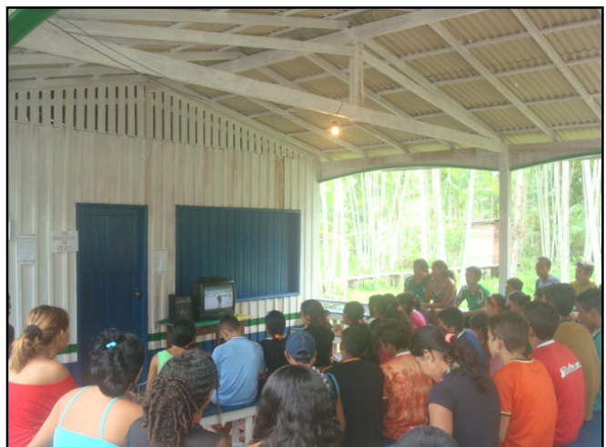
Figura 3: mídia audiovisual na escola, Joel Silva, 2010

O processo de globalização da comunicação está provocando importantes debates quanto à incorporação das mídias à prática educativa em todos os níveis e modalidades de ensino. Neste sentido, não pode haver exercício da cidadania sem “apropriação crítica e criativa, por todos os cidadãos, das mídias que o progresso técnico coloca à disposição da sociedade; e a prática de integrar estas mídias nos processos educacionais”. (BÉVORT & BELLONI, 2009, p. 1082).