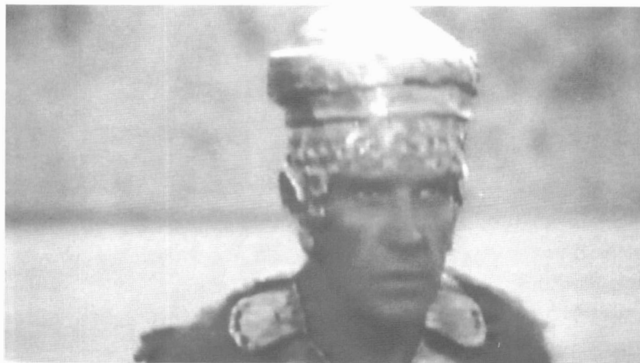
4 – Casco del rey corintio Creonte, inspirado en el casco áureo sumerio de Meskalamdug perteneciente al Dinástico Antiguo.