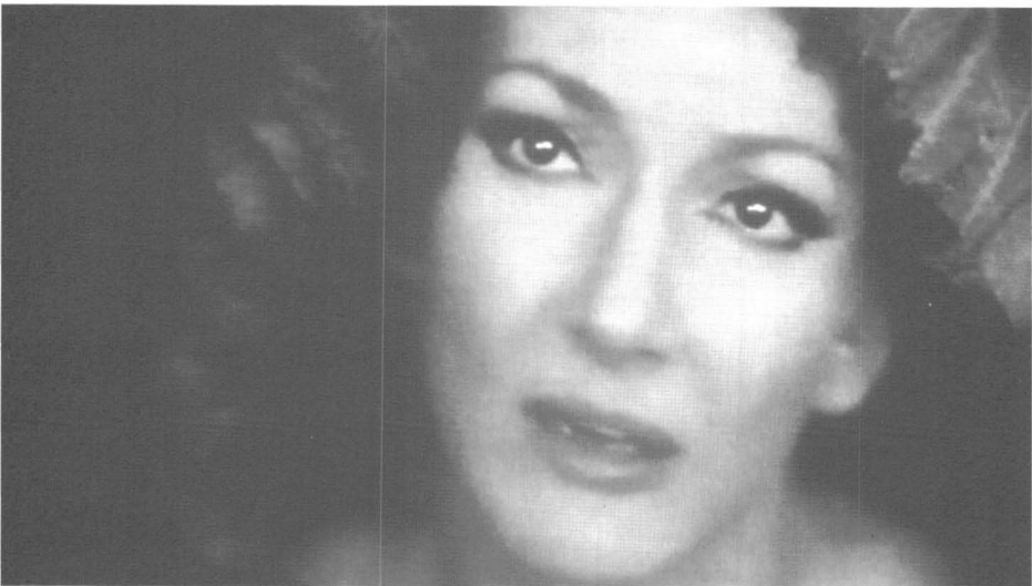
6 – Primer plano de una Medea esposa.