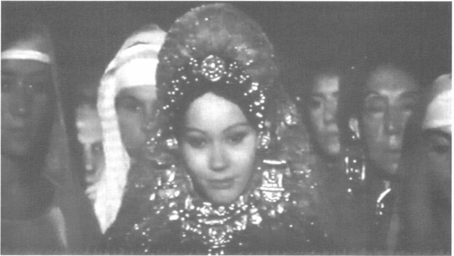
7 – Primer plano de la princesa corintia Glauce.