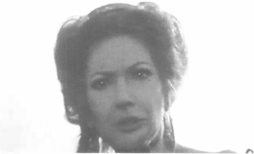
8 – Escena final del incendio, en la que una furibunda Medea discute con Jasón.