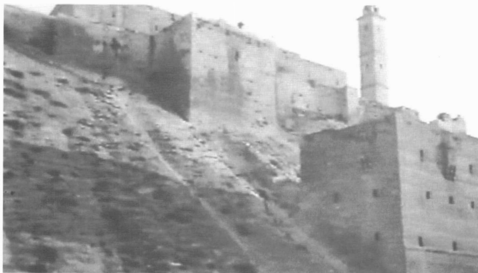
3 – Bastión asociado a la ciudadela de Alepo empleado como emplazamiento de la casa de Medea.