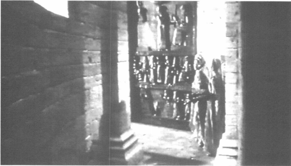
5 – Puerta de entrada al palacio corintio, inspirada en la Estela de Ur-Nammu del periodo de la III Dinastía de Ur.