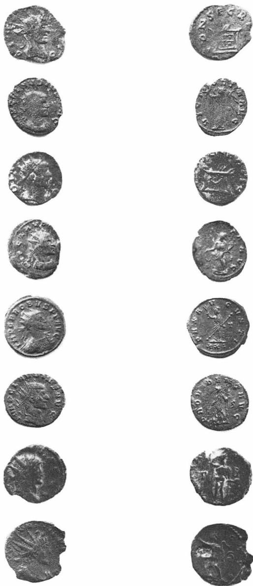
Lám. III: Anversos y reversos de las monedas 9-16