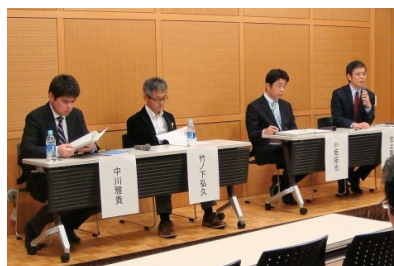
「アンケート調査から見える 多文化共生の最前線」報告会