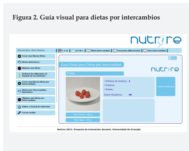
Figura 2. Guía visual para dietas por intercambios

Finalmente se ha incluido una herramienta que permite realizar una valoración antropométrica y de composición corporal, que permite establecer el somatotipo de un individuo y elaborar la correspondiente somatocarta. En la Figura 3 se muestra la página principal para la introducción de los datos antropométricos.