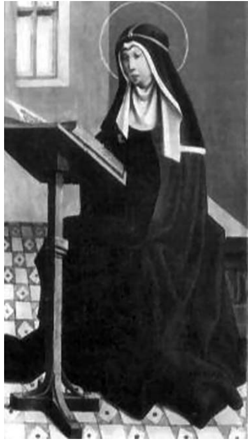
Santa Brígida de Suecia, Retablo de la Iglesia de Salem (Suecia).