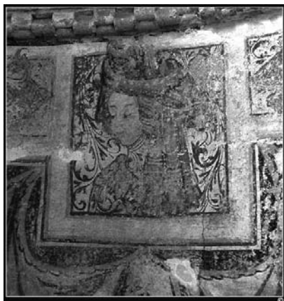
Mujeres representadas en la iglesia de Villar de Donas, en el Camino de Santiago.

aunque todas aducían que la piedad y la penitencia era lo que les movía para emprender el viaje, un estudio detallado de cada una aportaría motivos materiales diversos, pero, en último extremo, todos huían de algo que no les satisfacía plenamente.