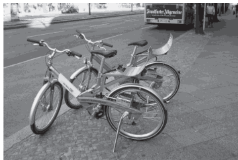
画像-6 ベルリンのレンタルサイクル「コール・ア・バイク」