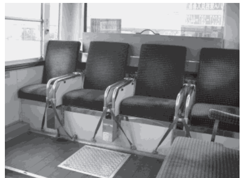
画像-7 前橋市内を走る自転車積載可能バス（座席間のスリットに前輪を固定する）

米国カリフォルニア州デービス市は自転車網が整備された「自転車のまち」として知られており、自動車道や歩道とは別に自転車道（バイクレーン）が整備され、自転車が日常生活の移動手段として市民権を得ている。また、オランダやドイツなど欧州の諸都市では、自転車が公共交通機関と同レベルに位置付けられ、日常の足として活用されている。ベルリンの「コール・ア・バイク」、パリの「ヴェリブ」などの市街地のレンタルサイクルシステム