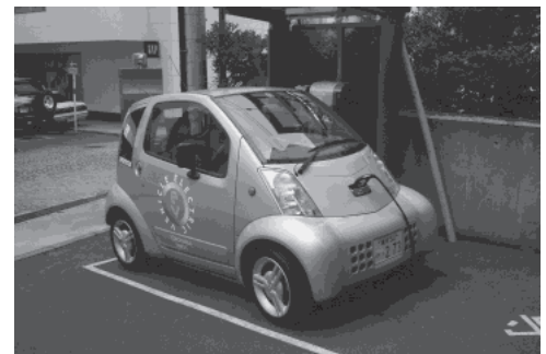
画像-4 電気自動車のカーシェアリング (CEVシェアリング)

日本では1999年から7年間、国の委託を受けたCEVシェアリング社が電気自動車のカーシェアリングの社会実験を行い、カーシェアリングのノウハウを蓄積した。その後、オリックス社が引き継いでガソリン車を用いたカーシェアリング事業を行っている。現在は都市部での業務利用が多いが、今後、集合住宅のサービスなどの需要が見込まれる。電気自動車のカーシェアリングについては、