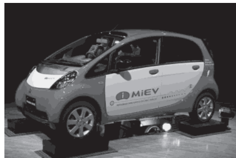
画像-3 電気自動車プロトタイプ (三菱自動車)

現在、年間約6千数百万台の自動車が生産され、保有台数は約9億台に達した。世界の人口7人に1台という割合である。自動車はその魅力や利便性とは裏腹に、地球温暖化などの環境問題や渋滞などの都市空間問題、さらには移動の安全性などの問題を抱えている。今後の持続可能な社会づくりを考える上で、自動車やモビリティのサステナブルなあり方は重要な課題である。これらをふまえ、環境負荷の少ない電気自動車と、車を共有するカーシェアリングについて情報を得るとともに、浜松地域での小さな電気自動車のカーシェアリングの可能性など、車とのスマートな付き合い方などについて討議した。