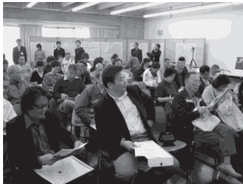
画像-8 自転車フォーラム 「わいわい座談会」