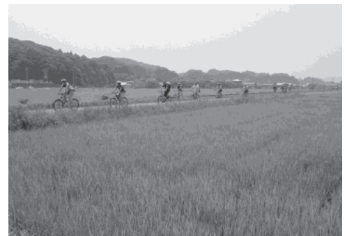
画像-5 田園を走るガイドツアー (スローライフ掛川)

自転車関連のインフラ整備が進まない理由として、都市や道路の計画者や行政担当者が実際に自転車に乗っていないことがあげられる。自転車利用者がまちづくり、みちづくりに関心を持って発言することが必要である。自転車の利便性については、国土交通省のデータでは5km以内の移動であれば自動車よりも早くて便利だとされている。東京都心で約8kmの距離を実際に走った実験では、自転車（クロスバイク／車道走行）が最も早く、鉄道＋折りたたみ自転車とタクシーの実走時