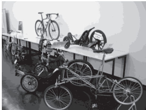
画像-9 おもしろ自転車展示