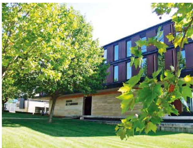
写真3. CIEF事務局が入る大学本部

大学公式webサイト ( http://www.u-bourgogne.fr/ )を見ると、海外62ヶ国、387大学と提携を結んでいる。日本は佐賀大、熊本大など5校と協定を結んでいるようだ。提携校のうち280校はヨーロッパ内で、これはEU加盟国間での学生流動を高めることを目的としたエラスムス・プログラム(The European Region Action Scheme for the Mobility of University Students : ERASMUS)が功を奏したための数であろう。今回訪問したCIEFでも、学期中にこのプログラムを利用してフランス語を学ぶヨーロッパ圏の大学生が多いため、夏学期は非ヨーロッパ圏の学生が多いと聞いた。