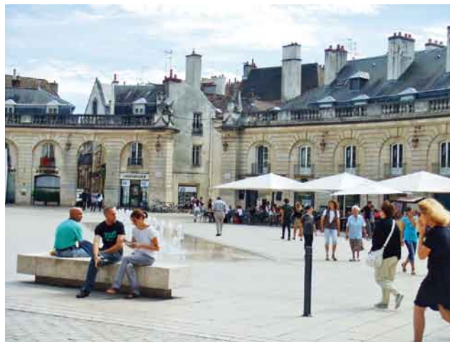
写真2. 市中心リベラシオン広場