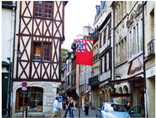
写真1. ディジョンの典型的な木組の家の街並

日本からディジョンへの行き方は、まずパリ、シャルル・ド・ゴール空港まで行く（直行便で成田、関西から12時間）。それからパリ市内のリヨン駅に移動してフランスの新幹線TGVに乗り、一時間半でディジョン駅に到着。また、ド・ゴール空港からディジョン駅まで直行のTGVが一日2便あるので（復路も同様）、空港からパリ市内への移動なしにダイレクトにディジョンへ入ることが可能である。