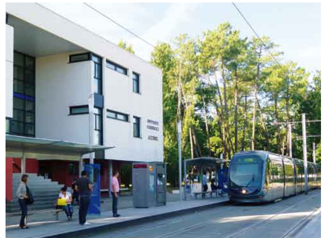
写真16. 校舎前にトラムが発着する。