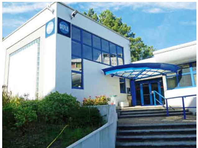
写真18. DEFLE校舎。階段教室もあり付属語学学校としては大規模

学費は1学期760ユーロ (約83,600円) である。宿舍として学生寮があり、ホームステイの斡旋も受けられる。留学する学生はDEFLEと連絡を取り合って宿舍やビザの手続きを進めることになる。9月の入学であれば6月には願書を出す必要がある。