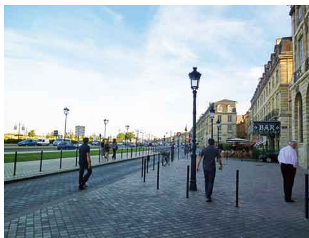
写真8. ガロンヌ川とブルス広場