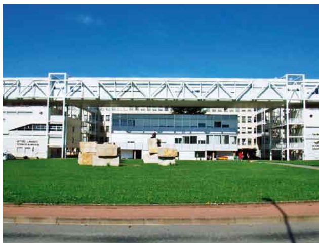
写真4. 人文系講義棟