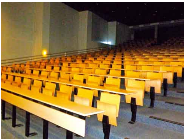
写真14. シンポジウム会場