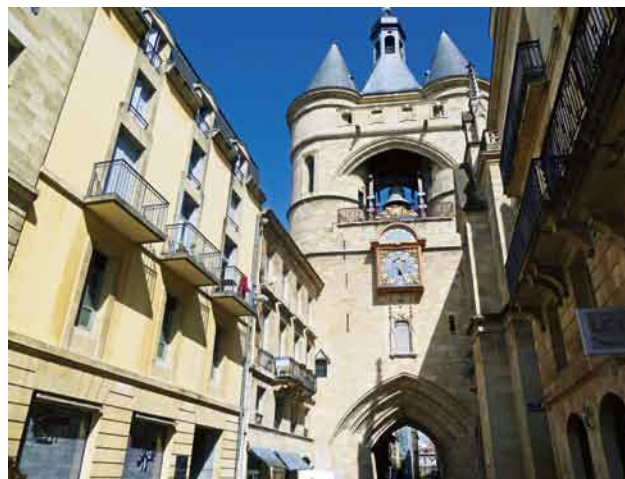
写真7. ボルドー市シンボル大時計

ンドレ大聖堂、サン・スーラン教会堂、サン・ミシェル教会堂の3ヶ所が「フランスのサンティアゴ・デ・コンポステーラの巡礼路」の一部として1998年に世界遺産に登録され、また、市内の歴史地区も「月の港ボルドー」として2007年に世界遺産に登録された。ボルドーまたは近隣の出身の著名な人物としてモンテーニュ、モンテスキュー、モーリアックなどがいる。