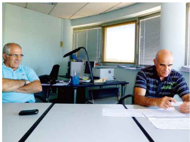
写真11. (左) ブルッス教授、(右) シッド学部長