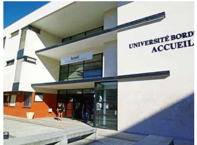
写真15. ボルドー第三大学事務管理棟