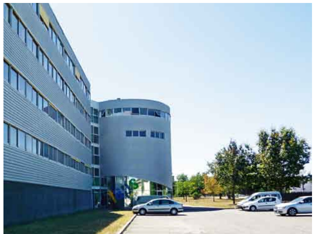
写真10. STAPS(スポーツ科学部)研究棟