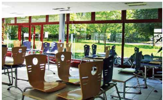
写真6. 留学生宿舎食堂