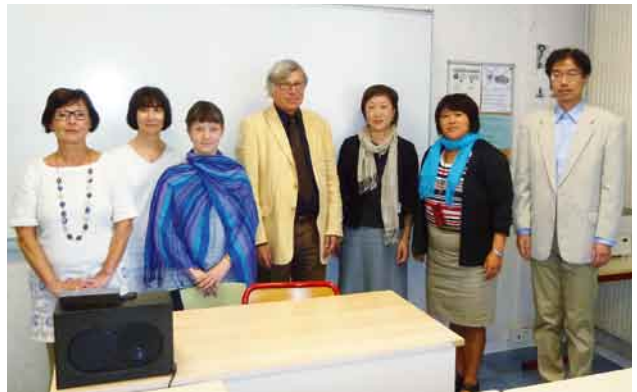
写真19. DEFLEスタッフ、ポルチーヌ部長 (中央)