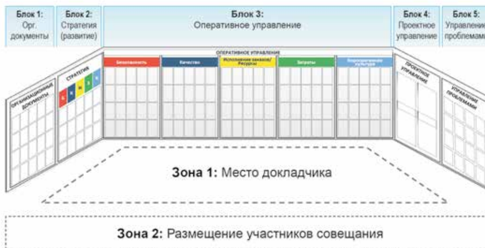
Рис. 4. Инфоцентр уровня руководителя предприятия

работ и услуг на горизонте жизненного цикла оборудования реакторных установок и оборудования различных типов для атомных электрических станций. АО «ОКБМ Африкантов» принимает участие в решении задач госкорпорации «Росатом» и дивизионов атомной отрасли [Публичный годовой отчет, 2018; Брыкалов, 2016].