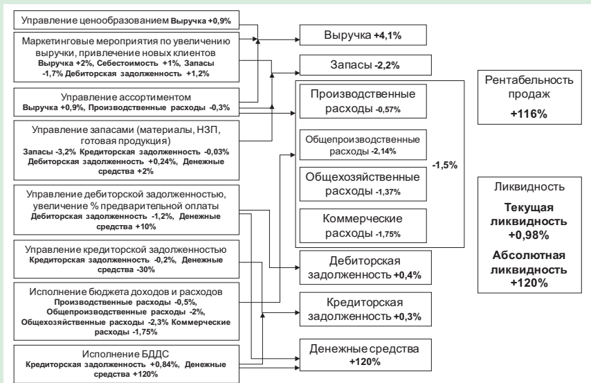
Рис. 3. Апробация организационно-экономического механизма

Пример использования организационно-экономического механизма для процессов промышленного предприятия приведен на рис. 3. На период внедрения организационно-экономического механизма управления промышленным предприятием была установлена цель – увеличение показателей рентабельности про-